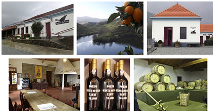
Clichés de Philippe Baumert, février 2014.

Illustration 3 : L'œnotourisme au sein de la Quinta do Tedo (propriété de Vincent Bouchard située à Folgosa). De gauche à droite, de haut en bas : clichés de la Quinta do Tedo, du Rio Tedo et des vignobles, du nouveau bâtiment destiné à héberger les touristes, de la salle de dégustation avec ses bouteilles de Porto et du lagar.