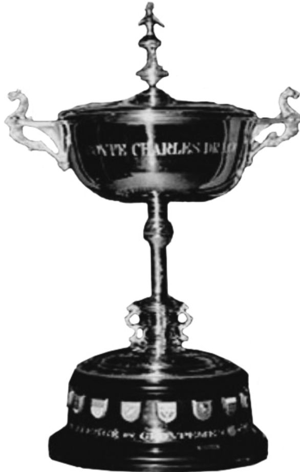
Figure n° 2 : La Coupe Charles Drago.

France, avec ses argents ternis, pâlirait : elle aurait presque l'air d'une parente pauvre 28 !