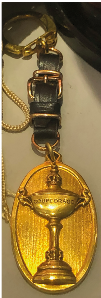
Figure n° 4 : Photographie d'un médaillon représentant le trophée de la Coupe Drago exposé à l'exposition permanente du Musée des Verts à Saint-Étienne.