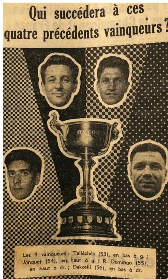
Figure n° 3 : Montage iconographique publié dans L'Équipe (6 juin 1957) avant la finale Olympique de Marseille-Racing Club de Lens.