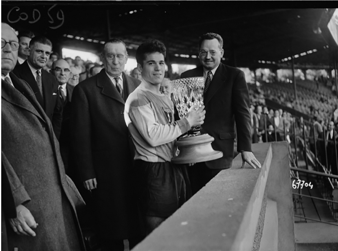
Figure n° 5 : Le capitaine du Racing club de Lens reçoit le trophée de la coupe nationale des juniors, après la victoire de son équipe au Parc des Princes face à l'AS Saint-Étienne le 18 mai 1958.