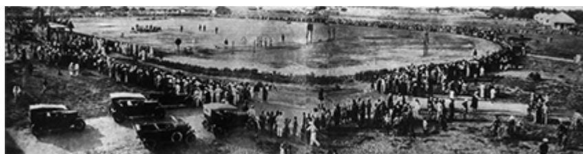
Figure n° 1 : photographie du stade de Lomé (Togo) en 1929.

L'entre-deux-guerres voit le développement de la pratique des sports et du football dans les villes coloniales d'Afrique sub-saharienne. La population indigène, notamment les « évolués », se passionne pour le football promu par les missionnaires. L'un des premiers grands clubs togolais, l'Étoile filante de Lomé, s'adjuge en 1960, la Coupe de l'AOF.