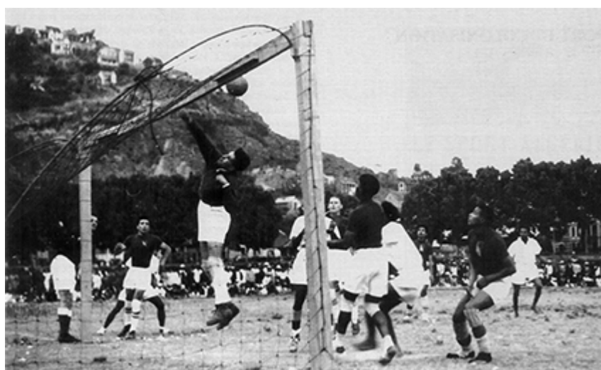
Figure n° 2 : match de football à Tananarive en 1947.

Le match a lieu l'année de l'insurrection malgache dont la répression fit 40 000 morts et de la création de la ligue de football de Madagascar affiliée à la Fédération française de foot-