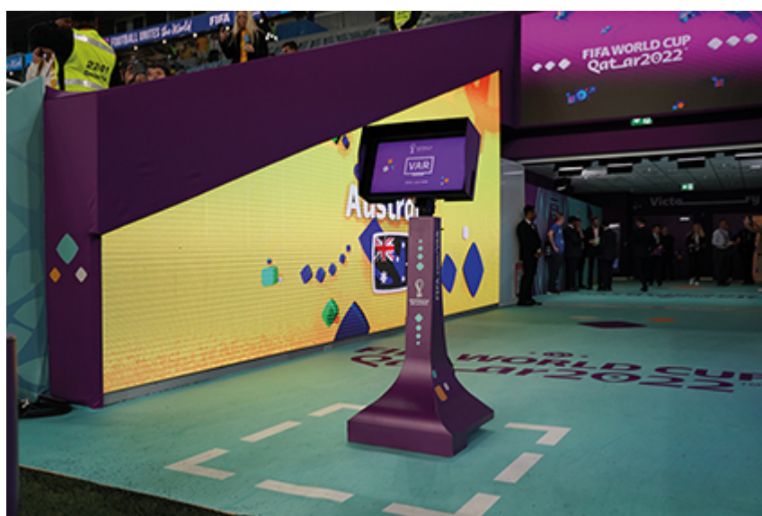
Figure n° 2 : L'écran de télévision de la VAR réservé à l'arbitre de champ lors du match de premier tour France-Australie de la Coupe du monde 2022 au Qatar (22 novembre 2022).