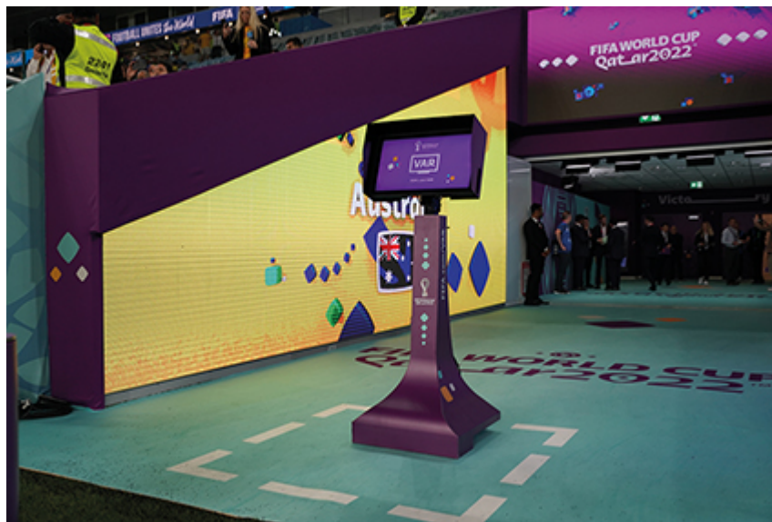
Figure n° 2 : L'écran de télévision de la VAR réservé à l'arbitre de champ lors du match de premier tour France-Australie de la Coupe du monde 2022 au Qatar (22 novembre 2022).