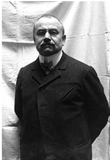
Figure n° 3 : Le dirigeant Charles Brennus.

Charles Brennus, le président de la commission rugby de l'USFSA en 1906. Maître-graveur il a fabriqué le trophée du championnat de France, aujourd'hui Top 14, dit bouclier de Brennus.