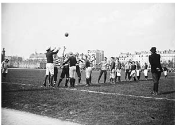
Figure n° 2 : Match Stade Français-Rosslyn Park, 1893.

Remise en touche lors du match Stade Français-Rosslyn Park de Londres disputé à Paris au Champ de Mars le 3 avril 1893.