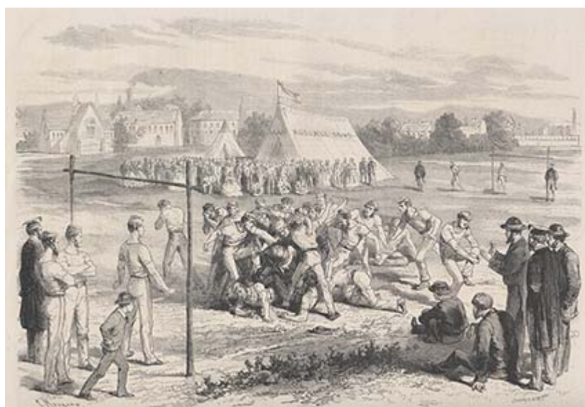
Figure n° 1 : Une partie de football, Le Monde Illustré , 14, décembre 1867.

L'une des premières représentations du football publiées en France. La gravure insiste sur le caractère violent du jeu combinant élément du football et du rugby.