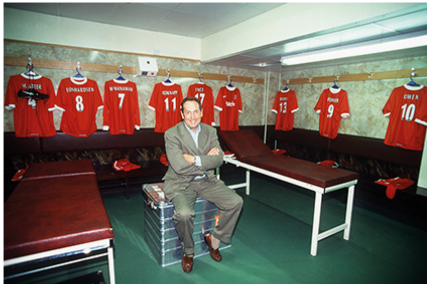
Figure 2 : G rard Houllier dans le vestiaire des Reds en 1998.

Cr dit : PresseSports, Daniel Bardou/Presse Sports.