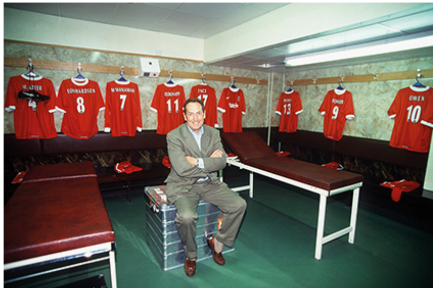
Figure 2 : Gérard Houllier dans le vestiaire des Reds en 1998.