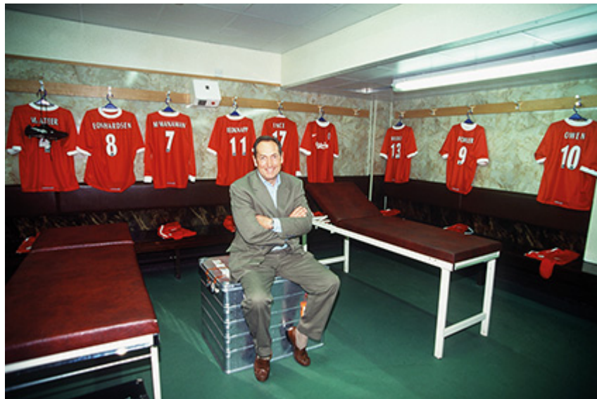
Figure 2 : Gérard Houllier dans le vestiaire des Reds en 1998.