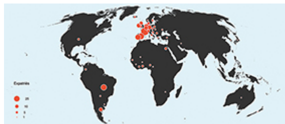
Figure 7 : les joueurs « expatriés » en Premier League, saison 2020-2021.