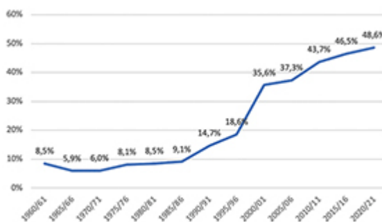
Figure 2 : évolution du % d'expatriés, par ligue (1960-2020).