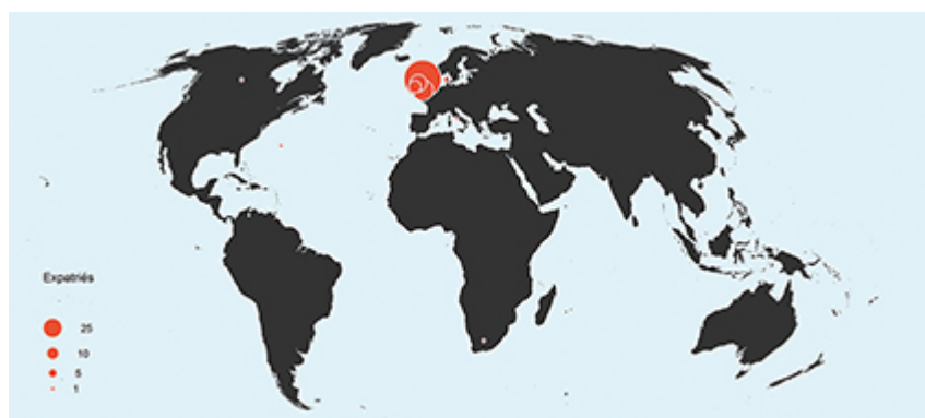
Figure 3 : les joueurs « expatriés » en First Division, saison 1970-1971.