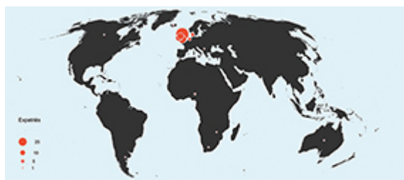
Figure 4 : les joueurs « expatriés » en First Division, saison 1985-1986.