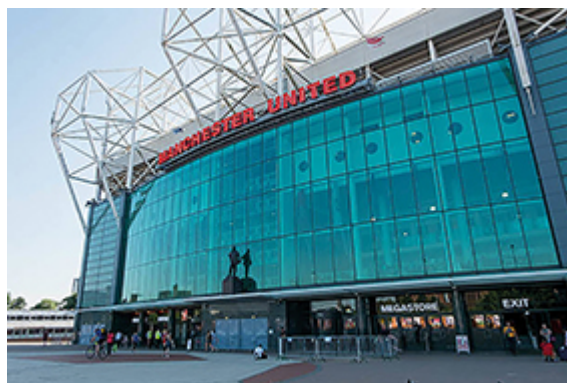
Figure 2 : le mégastore de Manchester United à Old Trafford.