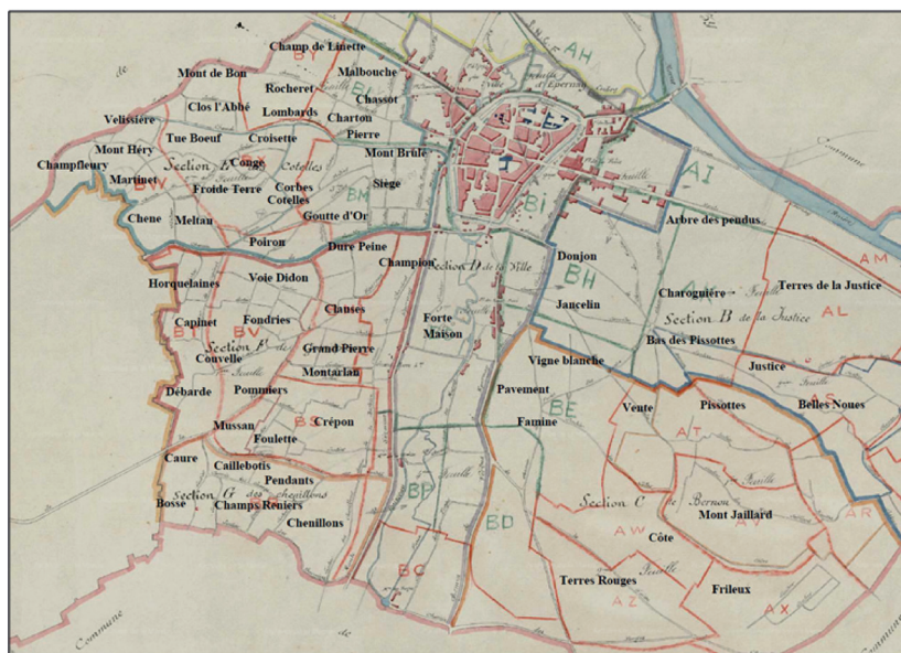
Figure 2 : Toponymes d'Epernay d'après les plans cadastraux, 1827 (partie ouest et sud-est viticoles).

même cinq à dix fois pour les « têtes de cuvées » des religieux d'Hautvillers ou de Pierry 12 . Au-delà du lieu, la qualité du propriétaire vient ajouter une garantie d'origine et surtout de qualité supplémentaire jouant, à l'image du lieu, une fonction de « label » pour le consommateur parisien dans un marché toujours incertain et géographiquement éloigné.