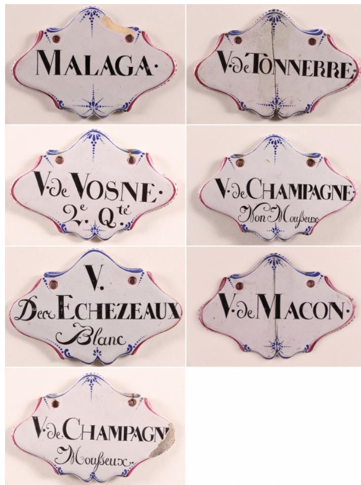
Figure 1. 7 grandes plaques en faïence de réverbère, L. 15 cm, Aprey, c. 1765-1770, musée de Langres

N° d'inventaire : 943-2-143 ; 943-2-141 ; 943-2-49-81 ; 943-2-50 ; 943-2-18 ; 943-2-49 ; 943-2-140.