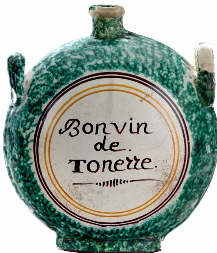
Figure 3. Gourde à deux passants, h. 25,5 cm, insc. Bon vin/ de/ Tonerre , Montigny-sous-Perreux, manif. du château, c. 1805. Musées d'Auxerre, inv 895.4.1

p. 51). Cet ancien vignoble a été réhabilité en 1998, et le « Muid mont-saugeonnais » produit aujourd'hui du vin de pays de la Haute-Marne.