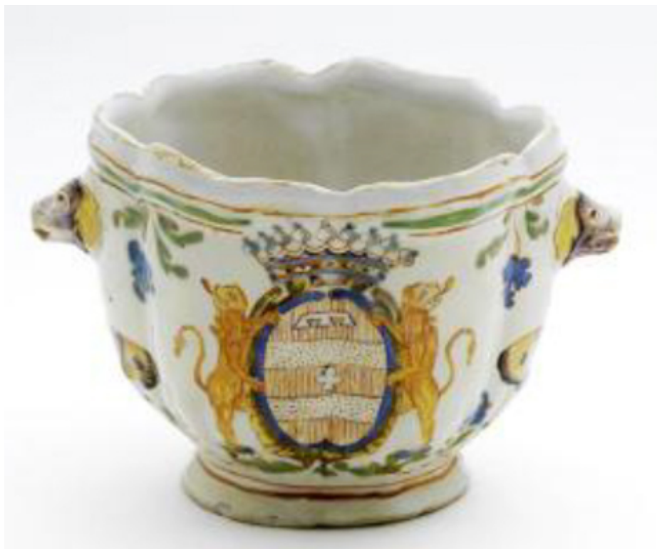
Figure 4. Rafrâichissoir à verre à mascarons, armoiries des Lamartine, h. 15 cm, Lyon, c. 1760. Lyon, musée des arts décoratifs, inv. MAD 2153