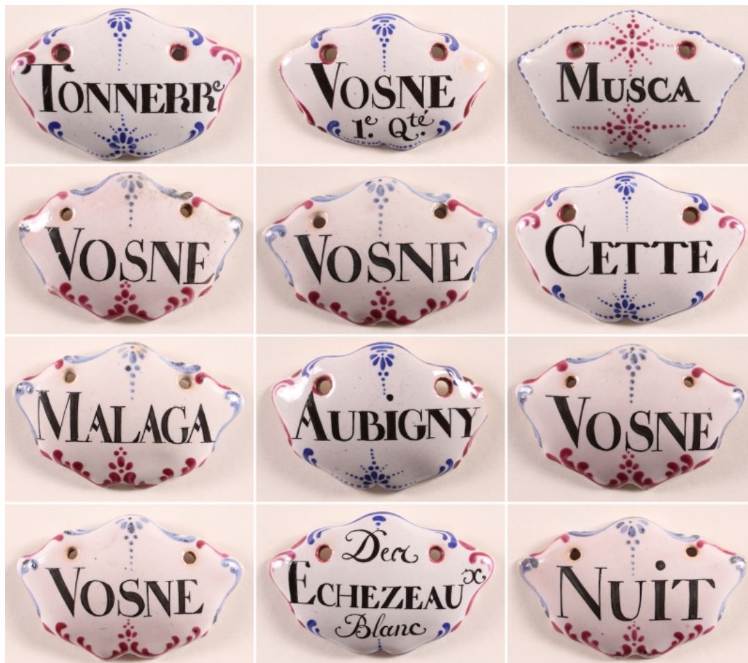
Figure 2. 12 petites plaques en faïence de réverbère, L. 6,5 cm, Aprey, c. 1765-1770, musée de Langres

N° d'inventaire : 943-2-311 ; 943-2-54 ; 943-2-55 ; 943-2-56 ; 943-2-57 ; 943-2-59 ; 943-2-60 ; 943-2-61 ; 943-2-62 ; 943-2-80 ; 943-2-82 ; 943-2-83.