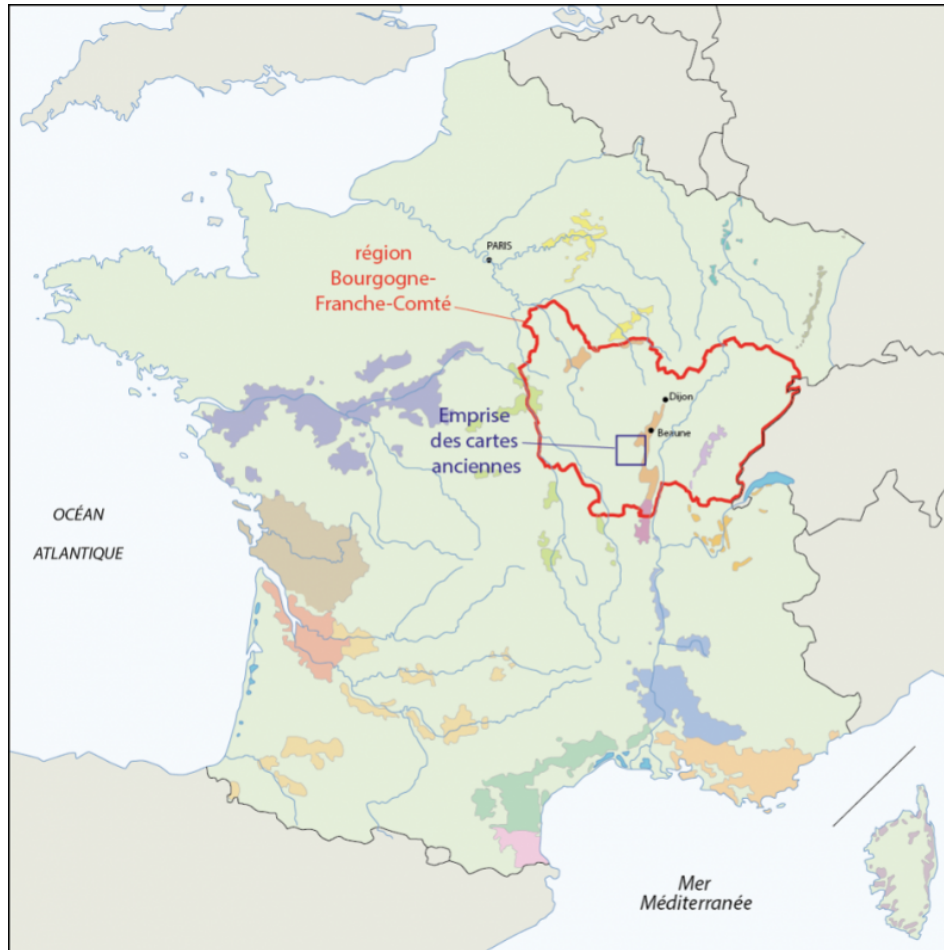
Figure 2. Zone représentée par les cartes des environs de « l'estang de Longpendu »