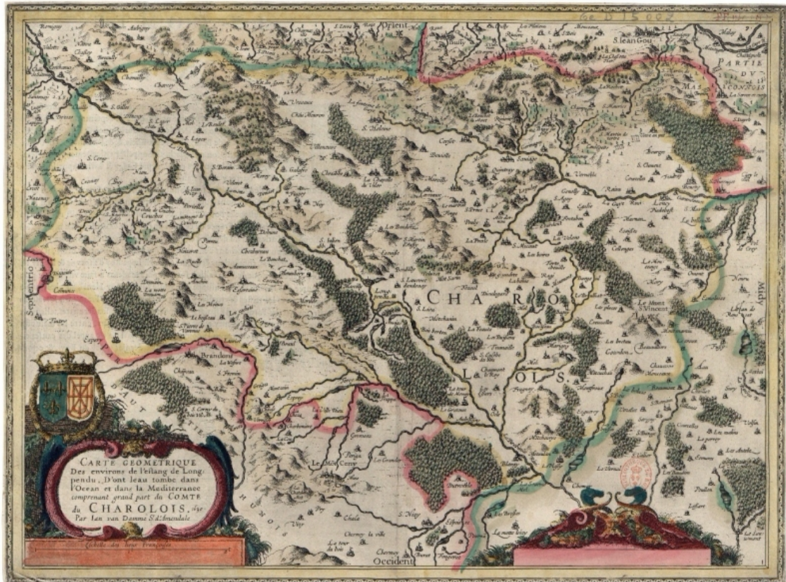
Figure 4. Carte géométrique des environs de l'estang de Longpendu, comprenant une grande partie du Comté du Charolois par Ian van Damme Sr d'Amen-dale

GE D-15002, BnF ( https://gallica.bnf.fr/ark:/12148/btv1b8493038x?rk=128756;0 ).