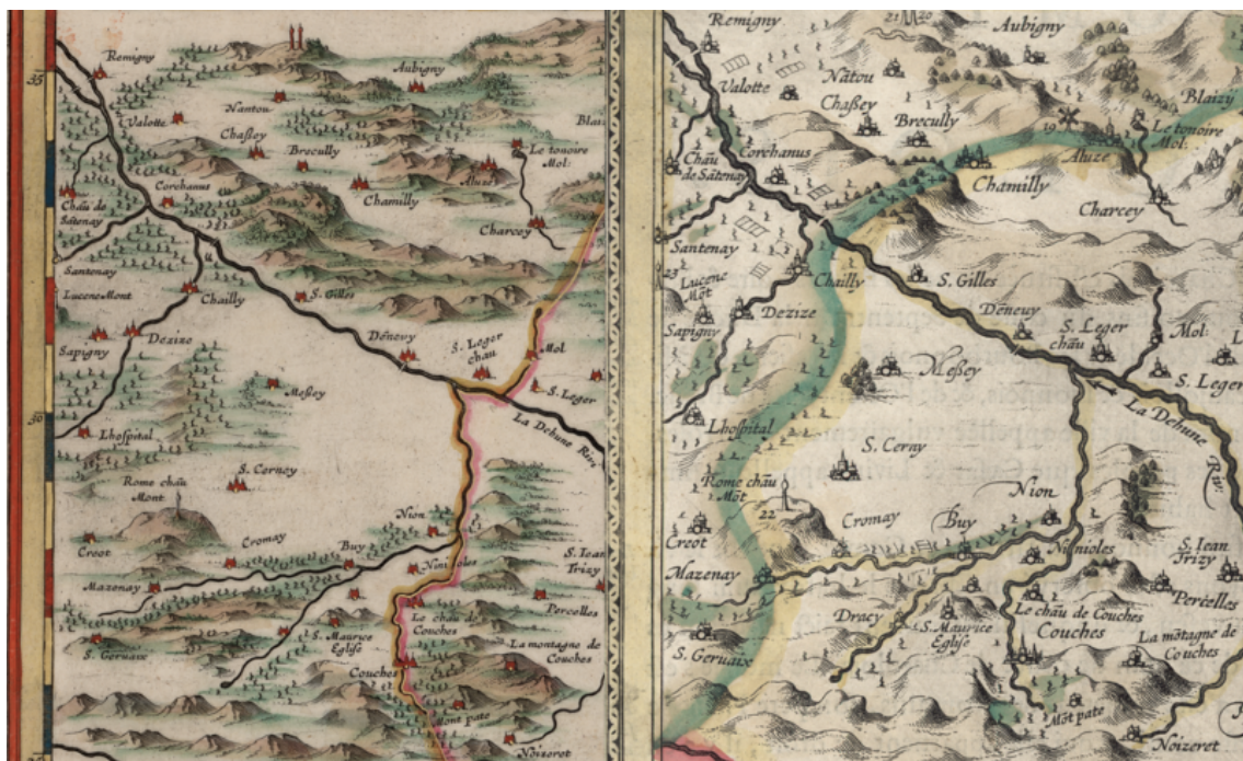
Figure 6 : comparaison des vignobles situés au Nord-Est des deux versions de la carte « des environs de l'étang de Longpendu »