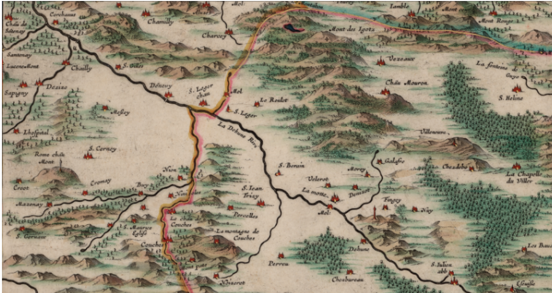
Figure 5 : Agrandissement de la figure 1 centrée sur la rivière Dheune et les bordures est et nord-est montrant les vignes et les forêts