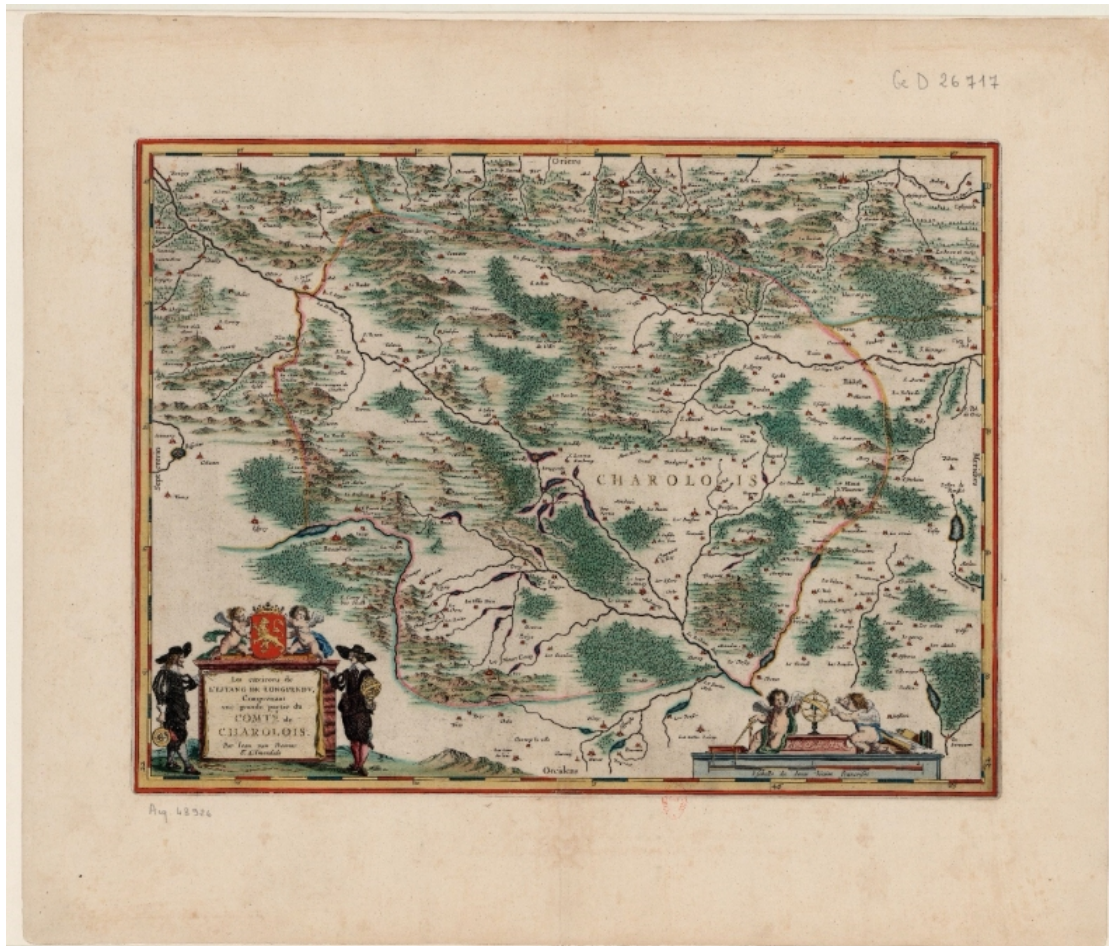
Figure 1. La carte des « Environs de l'étang de Longpendu, comprenant une grande partie du Comté du Charolois par Ian van Damme Sr d'Amendale »

Une représentation inattendue du vignoble bourguignon au xvie siècle : la carte des « Environs de l'étang de Longpendu »