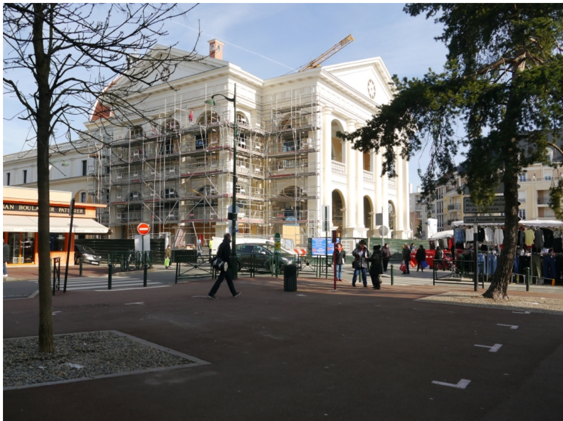
Figure 8. Le palais des arts Plessis Robinson. arch. Jean-Christophe Paul.