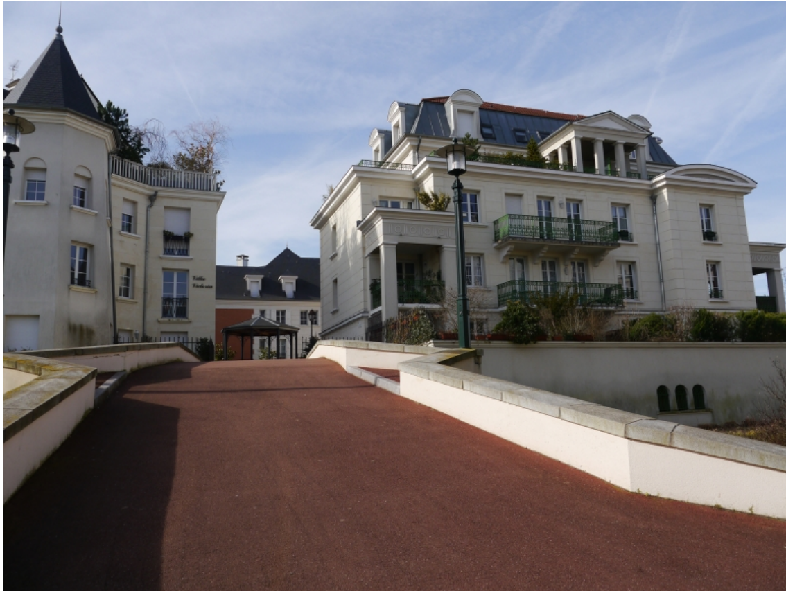
Figure 6. Site internet de la ville de Clamart Projet Le Nôtre copy.