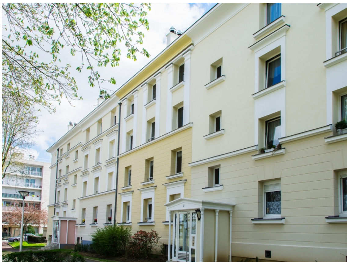
Figure 4. Une barre_rhabillée_au Plessis-Robinson.

Quelle discordance des temps fabriquons-nous ? Le succès des styles « néo » architecturaux, décors et projet de société dans le Grand Paris