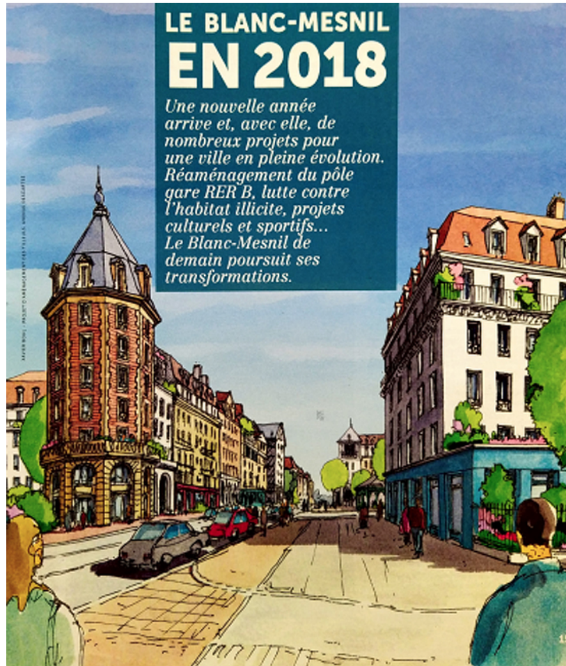
Figure 1. Le Blanc-mesnilois n°79 janvier 2018 copyHD.

Quelle discordance des temps fabriquons-nous ? Le succès des styles « néo » architecturaux, décors et projet de société dans le Grand Paris