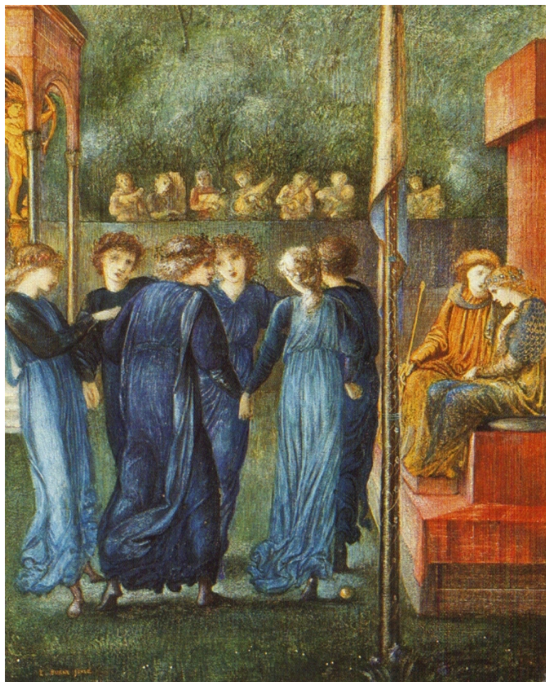
Figure 1 : Les Noces du roi (The King's Wedding), 1870, aquarelle et gouache avec or sur vélin ; 32 x 26 cm ; Neuss, Clemens-Sels-Museum.

https://commons.wikimedia.org/wiki/File:Burne_jones_king_s_wedding.jpg .