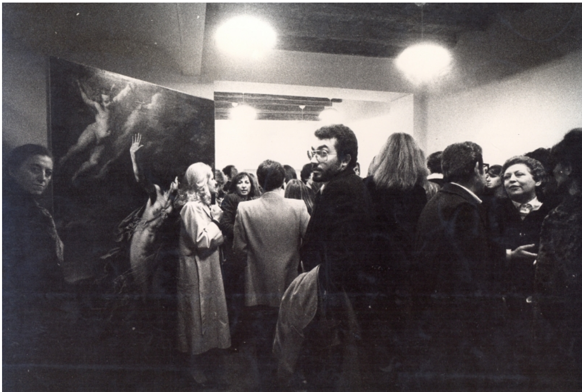
Figure 3. Ansicht der Eröffnungsausstellung der Cooperativa di Via Beato Angelico, 8 April 1976.

Darstellung der Göttin der Morgenröte, die mit gebieterischer Geste die Nacht zurückdrängt und einen neuen Tag einleitet, qua Display buchstäblich unter die versammelte Menge mischte (fig. 3). 37 Zwar lässt sich das doppelte Merkmal der Historizität und Aktualität prinzipiell jedem Kunstwerk der Vergangenheit zuschreiben, dem im Hier und Jetzt begegnet wird. Doch die Präsentationsmodi von Gentileschis Gemälde im Raum der engagierten Kooperative betonten die zeitgenössische Dimension der mythologischen, astronomisch eingebetteter Denkfigur Aurora und ihrer Autorin.