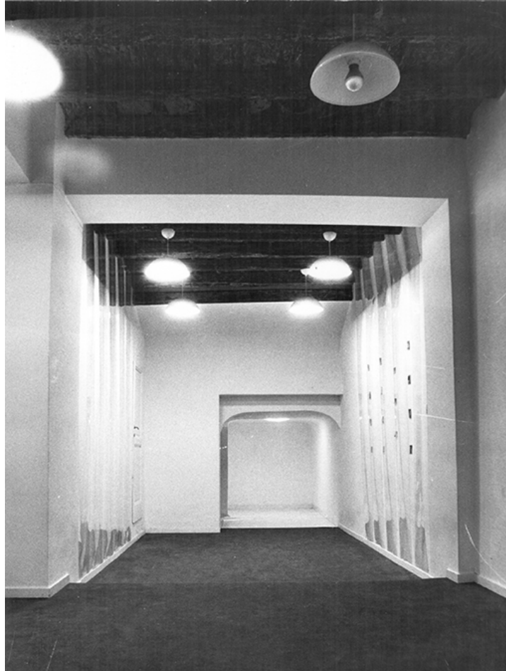
Figure 4. Carla Accardi, Origine , 1976, Cooperativa Beato Angelico, Rom, Installationsansicht.