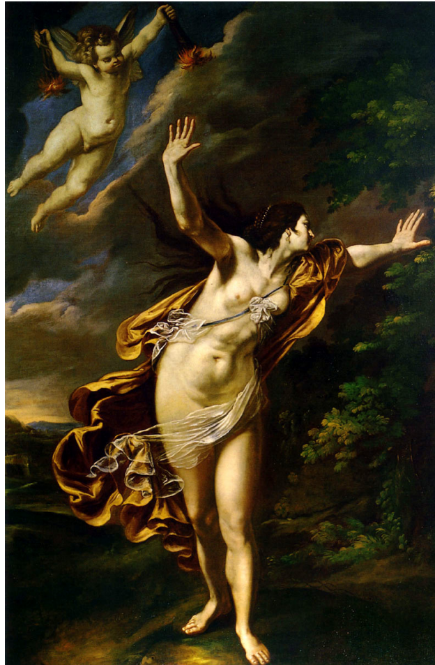
Figure 2. Artemisia Gentileschi, Aurora , ca. 1627, Öl auf Leinwand, 218 cm x 146 cm, Rom, Privatsammlung.