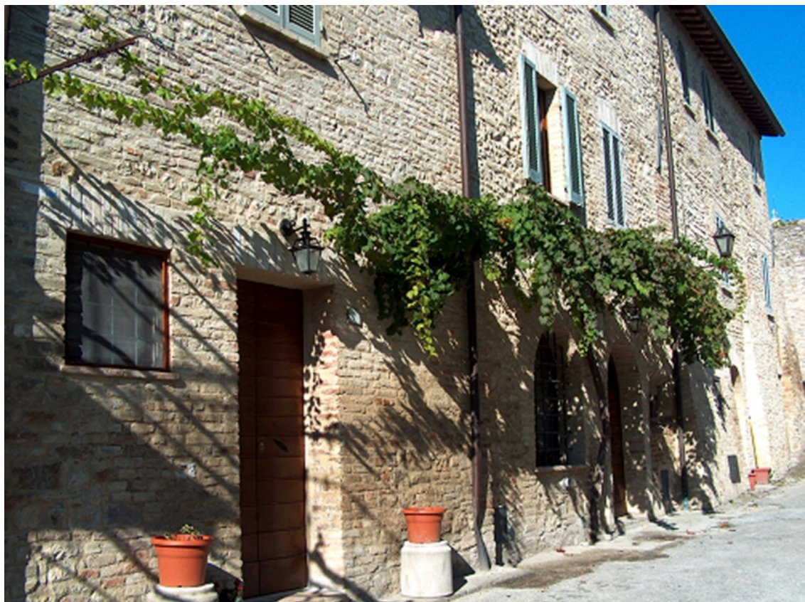
Fig. 2 – Nel centro storico di Montefalco sopravvivono tuttora antichi ceppi di Sagrantino , ciascuno dei quali “adottato” da una delle principali aziende vinicole della zona.