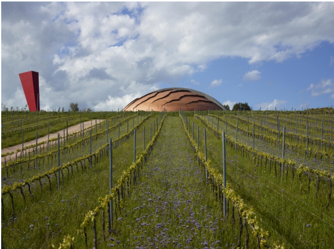
Fig. 4 - Tenuta Castelbuono. La cantina “Carapace” progettata dallo scultore Arnaldo Pomodoro.

è divenuta anche la funzione: non più semplice “contenitore”, ma luogo simbolico e di attrazione per visite e degustazioni.