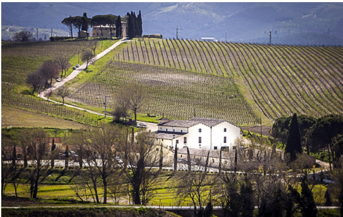
Fig. 3 – L'azienda Scacciadiavoli , nella quale è tuttora operativa la celebre cantina di monumentali dimensioni (“Cantinone”) fatta costruire dal principe Ugo Boncompagni Ludovisi alla fine del secolo XIX.