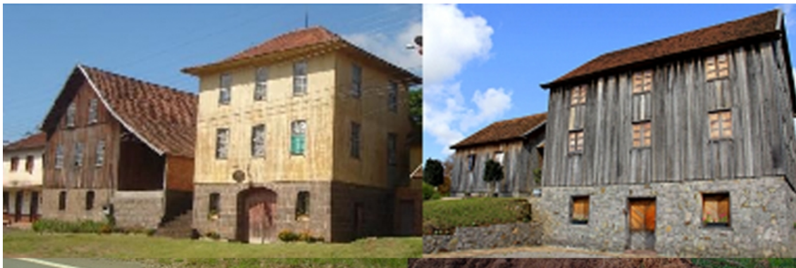
Figure 3 - L'architecture typiques des immigrants italiens dans la Serra Gaúcha