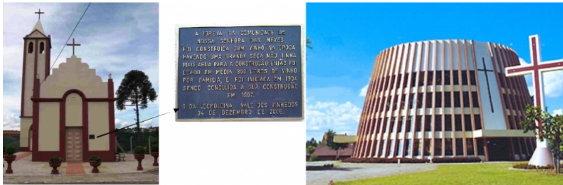
Figure 4 – L'église et le vin : la « Capela das Neves » et l' « Igreja São Bento »

1982 comme une forme d'hommage aux immigrants italiens et à leur principale activité, la vitiviniculture. Selon des informations fournies par la Préfecture, l'église fut la deuxième au monde à posséder cette architecture.