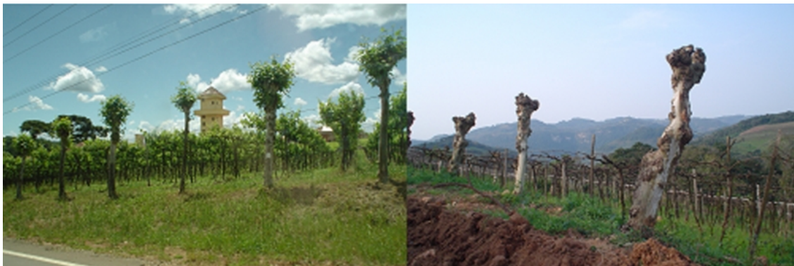
Figure 2 – Le vignoble du Vale dos Vinhedos : repères d'un héritage étrusque

culturelles sont un peu différentes dans les vignobles recherchés au Brésil (à savoir, Vale dos Vinhedos, Monte Belo do Sul et Pinto Bandeira). Ici, il y a un apport direct des immigrants dans le paysage et dans les pratiques agricoles locales, étant donné que la méthode de conduite n'est pas introduite au Brésil par les Étrusques, mais par les immigrants italiens arrivés au XIX ème siècle (Falcade, 2011).