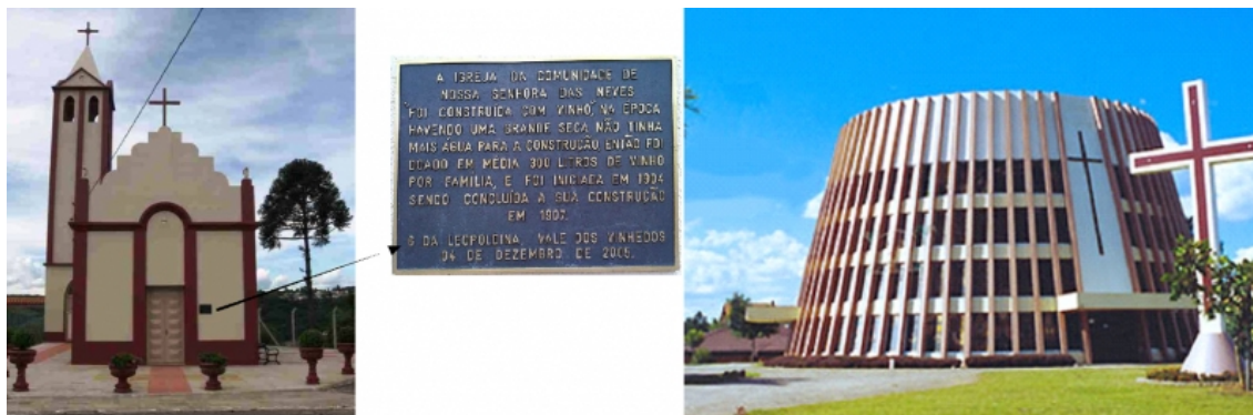
Figure 4 – L'église et le vin : la « Capela das Neves » et l' « Igreja São Bento »

1982 comme une forme d'hommage aux immigrants italiens et à leur principale activité, la vitiviniculture. Selon des informations fournies par la Préfecture, l'église fut la deuxième au monde à posséder cette architecture.