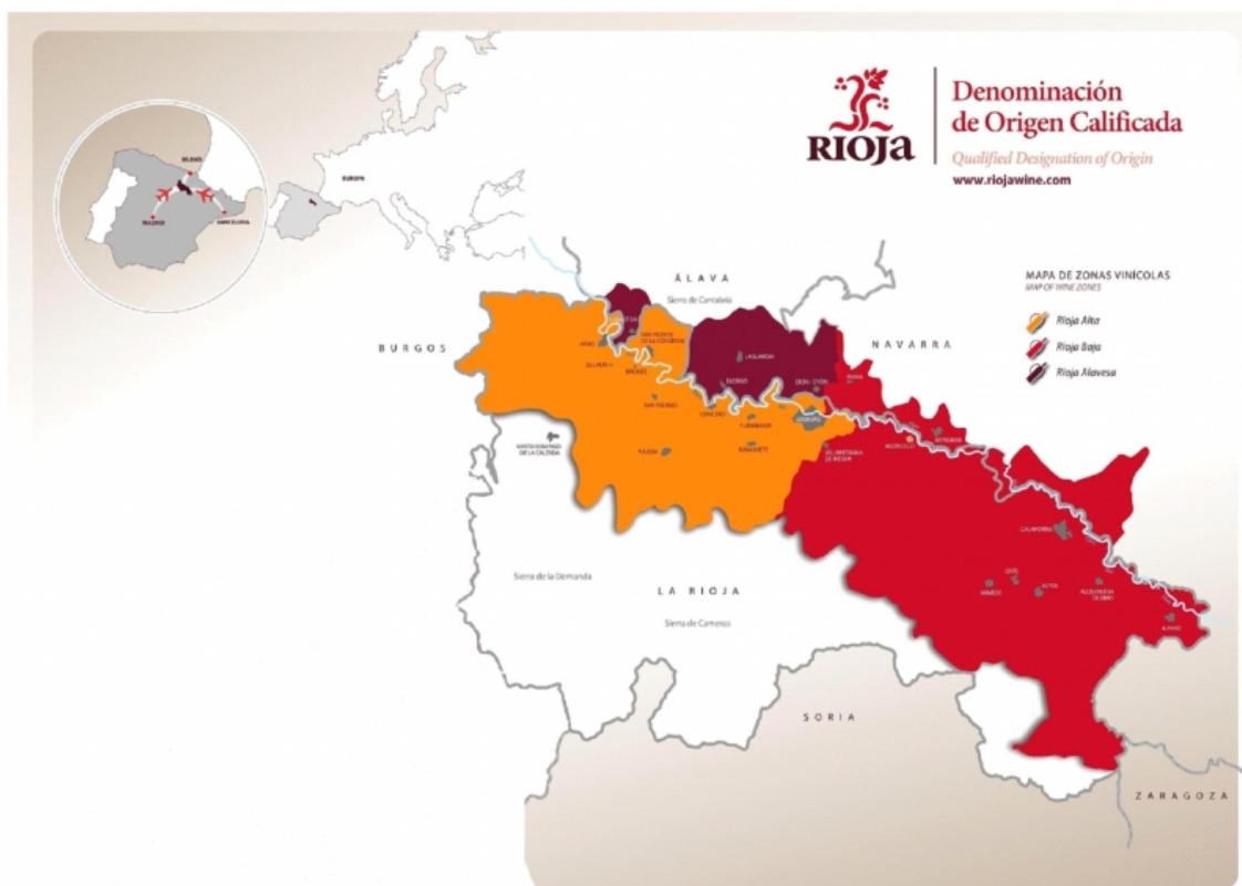
La D.O. Ca. Rioja (Communautés Autonomes et subzonas)