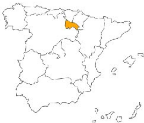
L'Espagne des Communautés Autonomes : localisation de La Rioja