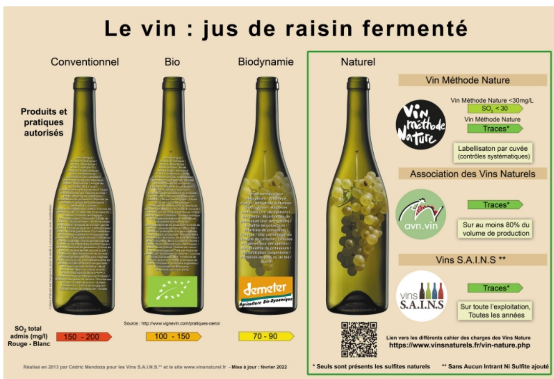
Illustration 1. Affiche réalisée en 2013 par Cédric Mendoza pour les vins S.A.I.N.S. et le site www.vinsnaturel.fr – mise à jour : février 2022.

Cette affiche est consultable sur le site vinsnaturels.fr à l'adresse suivante : https://www.vinsnaturels.fr/design/visuels/fr_2022_le_vin_naturel_v2.jpg .