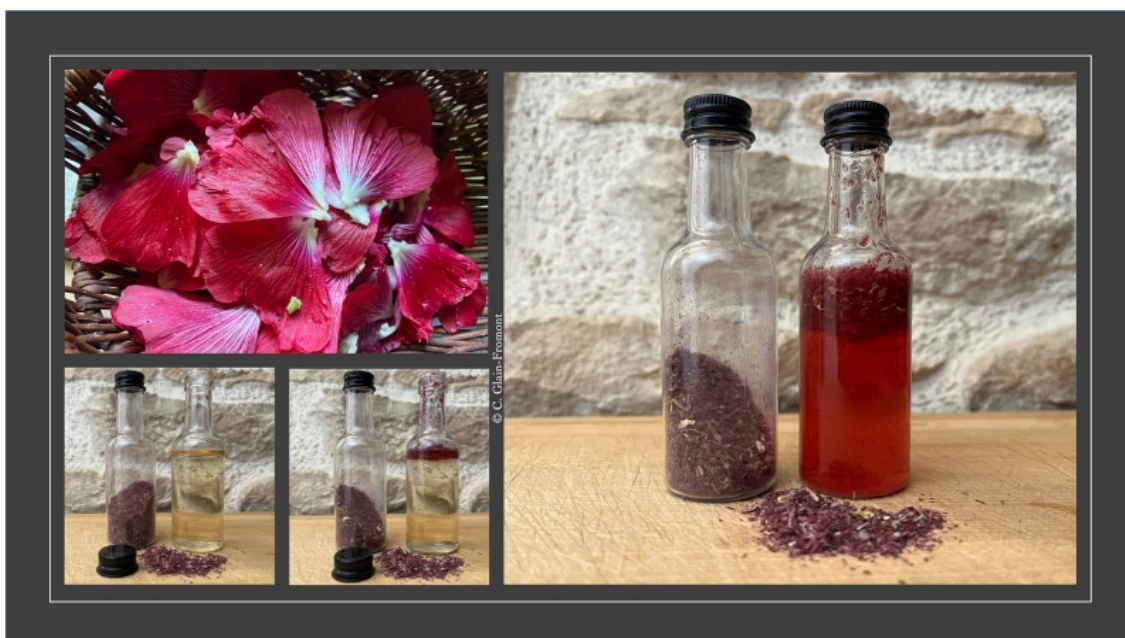
Expérimentation de coloration de vin blanc en vin rouge à l'aide de pétales de rose trémière séchée d'après le Ménagier de Paris vers 1393.

Illustration 4 : Expérimentation de coloration du vin blanc en vin rouge à l'aide de pétale de rose trémière séchée d'après le Ménagier de Paris, vers 1393.