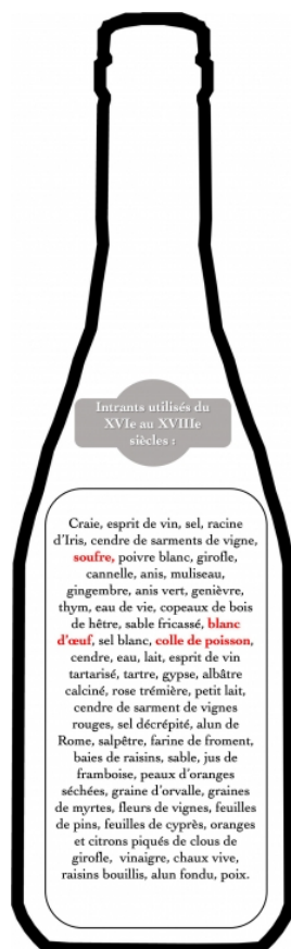
Illustration 6 : Liste des intrants indiqués pour l'élaboration, la vinification, l'élevage, la conservation ou la rectification des vins dans les différents ouvrages consultés entre 1572 et 1765.

Liste des intrants indiqués pour l'élaboration, la vinification, l'élevage, la conservation ou la rectification des vins, dans les différents ouvrages consultés entre 1572 et 1765