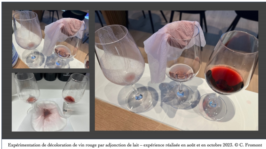
Illustration 5 : expérimentation de décoloration du vin rouge par l'adjonction de lait - Expérience réalisée en août et en octobre 2023.