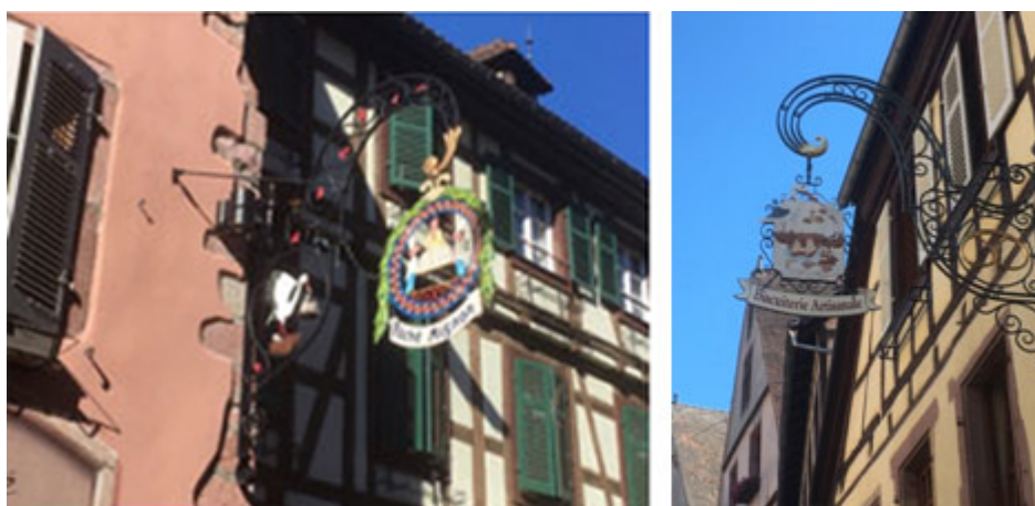
Illustration 2. Enseignes de boutiques vendant des pâtisseries et biscuits traditionnels (Kaysersberg)

Biscuits, bretzels et kougelhops font partie de l'offre gourmande alsacienne.