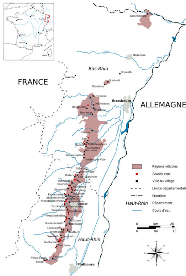
Illustration 1. Le vignoble alsacien. La route des vins passe par toutes les localités viticoles