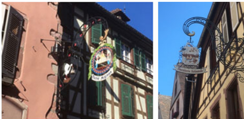
Illustration 2. Enseignes de boutiques vendant des pâtisseries et biscuits traditionnels (Kaysersberg)

Biscuits, bretzels et kougelhops font partie de l'offre gourmande alsacienne.