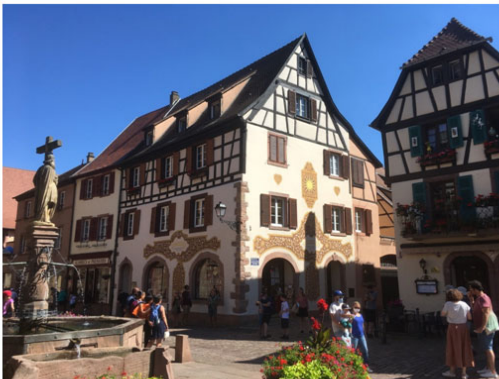
Illustration 4. Une des places de Kaysersberg avec fontaine et maison peinte

Kaysersberg, l'un des « villages préférés des Français » en Alsace. La rue piétonne et les façades à colombages colorées sur lesquelles sont suspendues des jardinières de géraniums constituent l'une des images de l'authenticité des localités du vignoble.