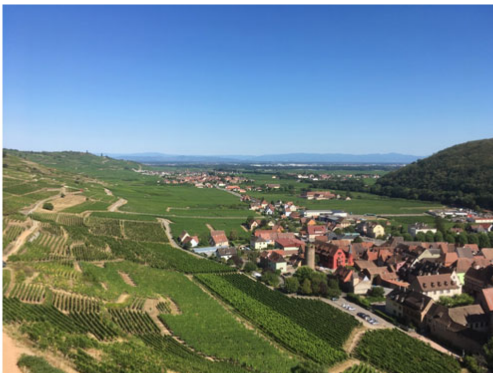
Illustration 3. Le vignoble de Kayserserg et son bourg au pied des vignes, vallée de la Weiss

Les vignes en terrasses (appellation grand cru Schlossberg) se découvrent par des sentiers de randonnée dominant la ville (premier plan) et menant au château de Kaysersberg. La vallée s'ouvre sur la plaine d'Alsace et le village de Kintzheim (second plan). A l'arrière-plan s'affiche la Forêt Noire allemande. Sur la partie droite de la photographie : une des collines sous-vosgiennes formant la transition entre la montagne et la plaine.