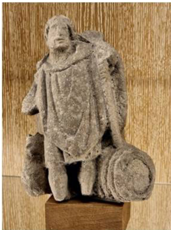
Illustration 2. Statuette de Sucellos, dieu gaulois du vin