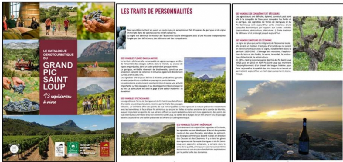
Illustration 7. Visuels de communication de la Communauté de Communes Grand Pic Saint-Loup