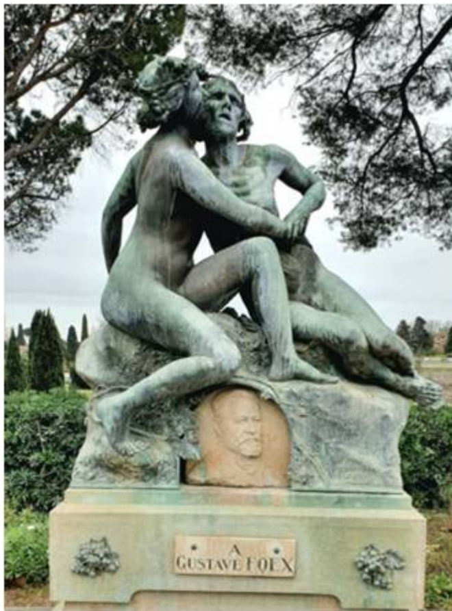
Sculpture de Jacques Villeneuve en l'honneur de Gustave Foëx, campus de Montpellier SupAgro.