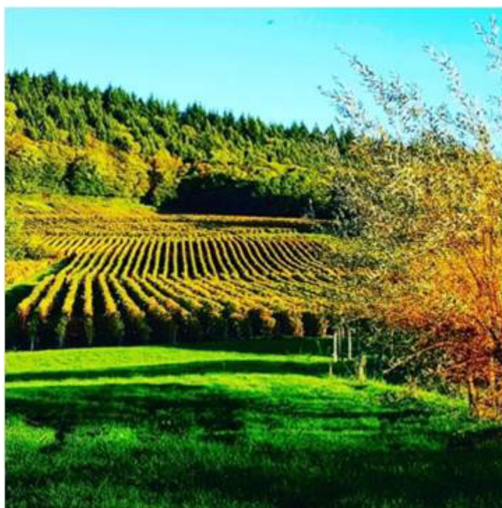
Illustration 1. Paysage du vignoble jurassien

Remettre en lumière les patrimoines culturels locaux de la vigne et du vin Faire comprendre la dynamique géohistorique du vignoble Révéler la personnalité du vignoble En conclusion