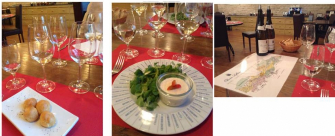
Illustration 4. La table de dégustation d'Olivier Leflaive

Source : cliché Sophie Lignon Darmaillac, avril 2015.