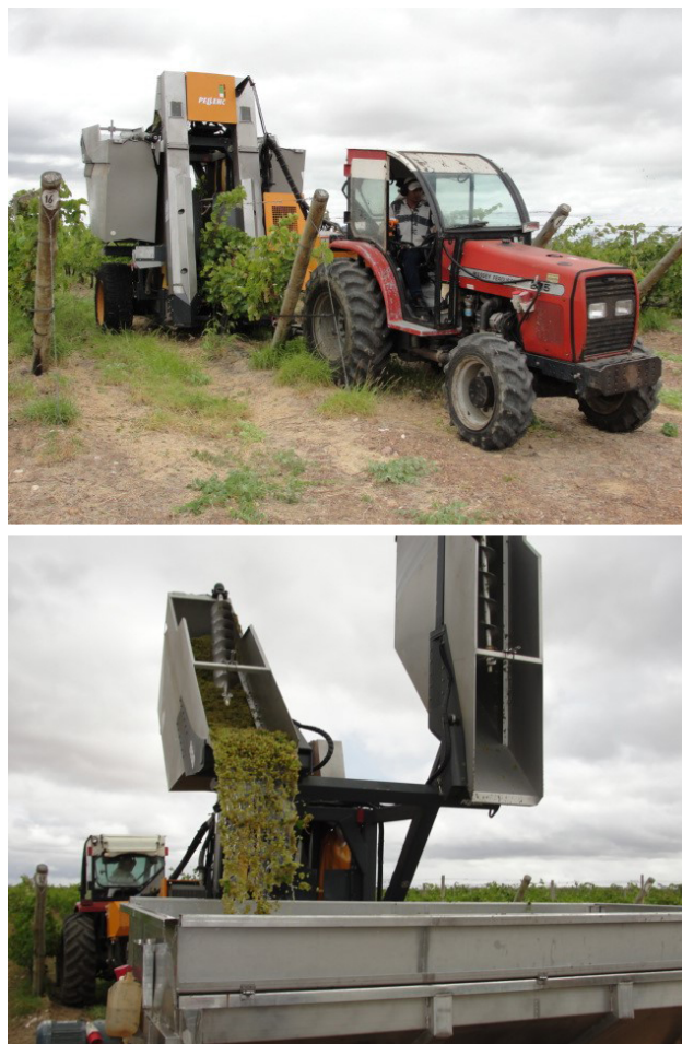
Figure 4. Vendange mécanique du Chenin Blanc dans une entreprise viticole de la municipalité de Casa Nova – BA.