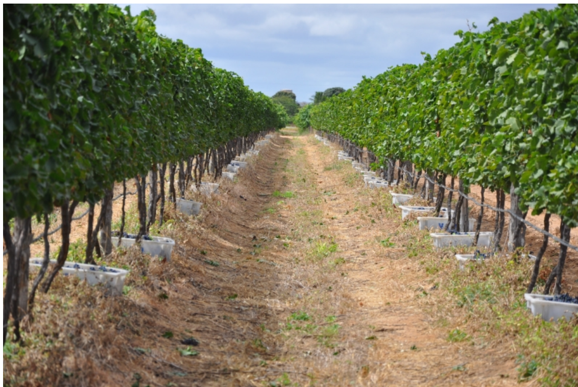
Figure 3. Cépage Tempranillo conduit en espalier, pendant les vendanges, dans une entreprise vinicole de la municipalité de Lagoa Grande – PE.