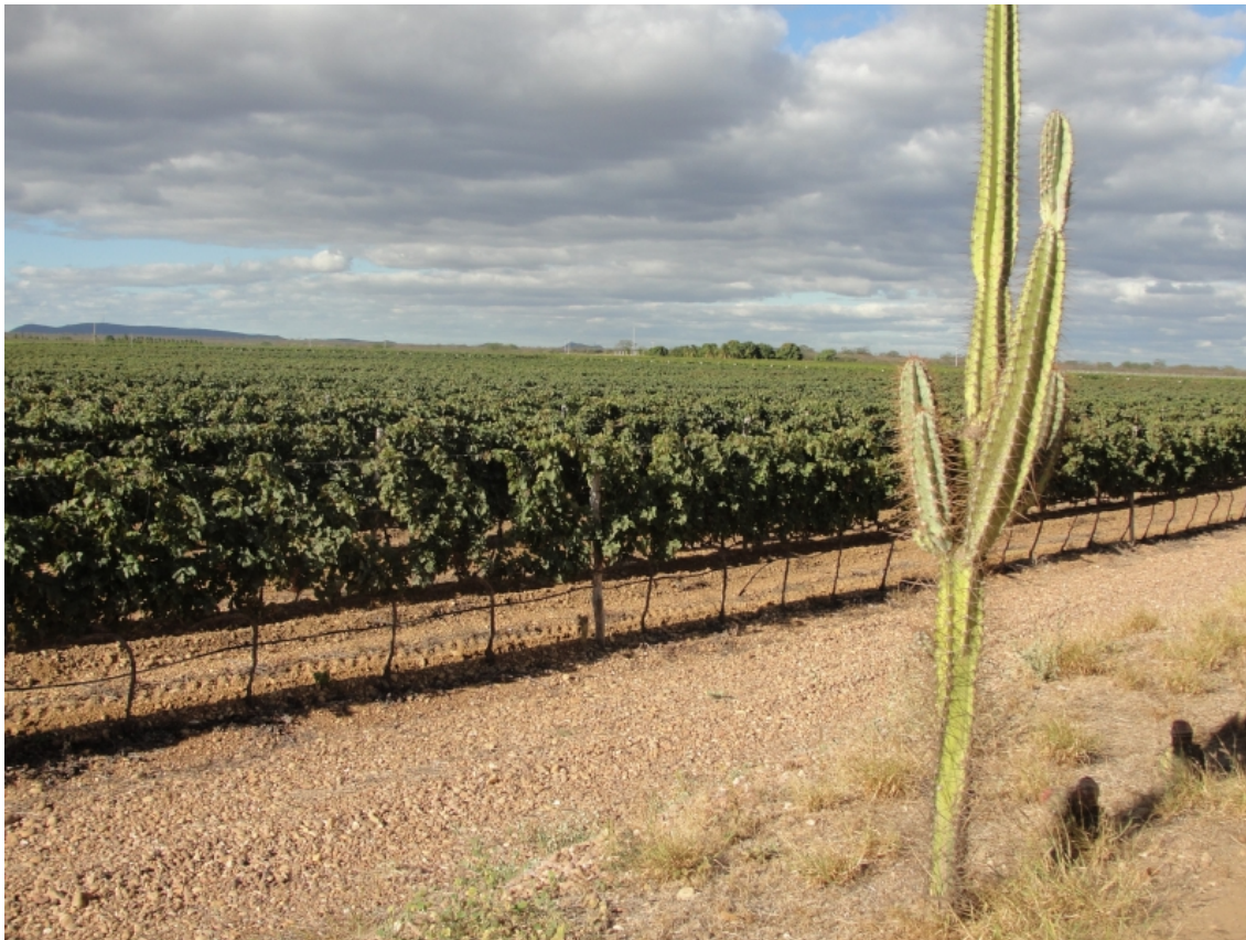
Figure 2. Cépage Tempranillo conduit en espalier dans une entreprise vinicole de la municipalité de Lagoa Grande – PE.