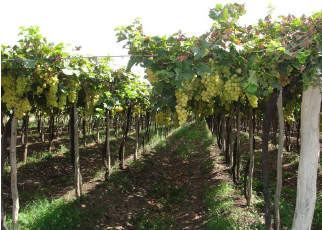
Figure 1. Cépage Moscato Itália planté en pergola, dans une entreprise vinicole située dans la municipalité de Casa Nova – BA.