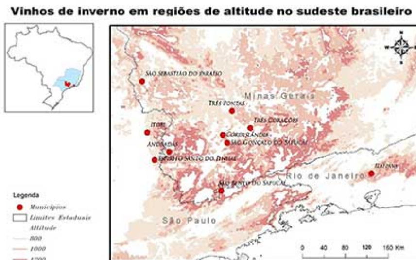
Figure 2. Carte de la région sud-est du Brésil et des municipalités productrices de vin d'hiver.