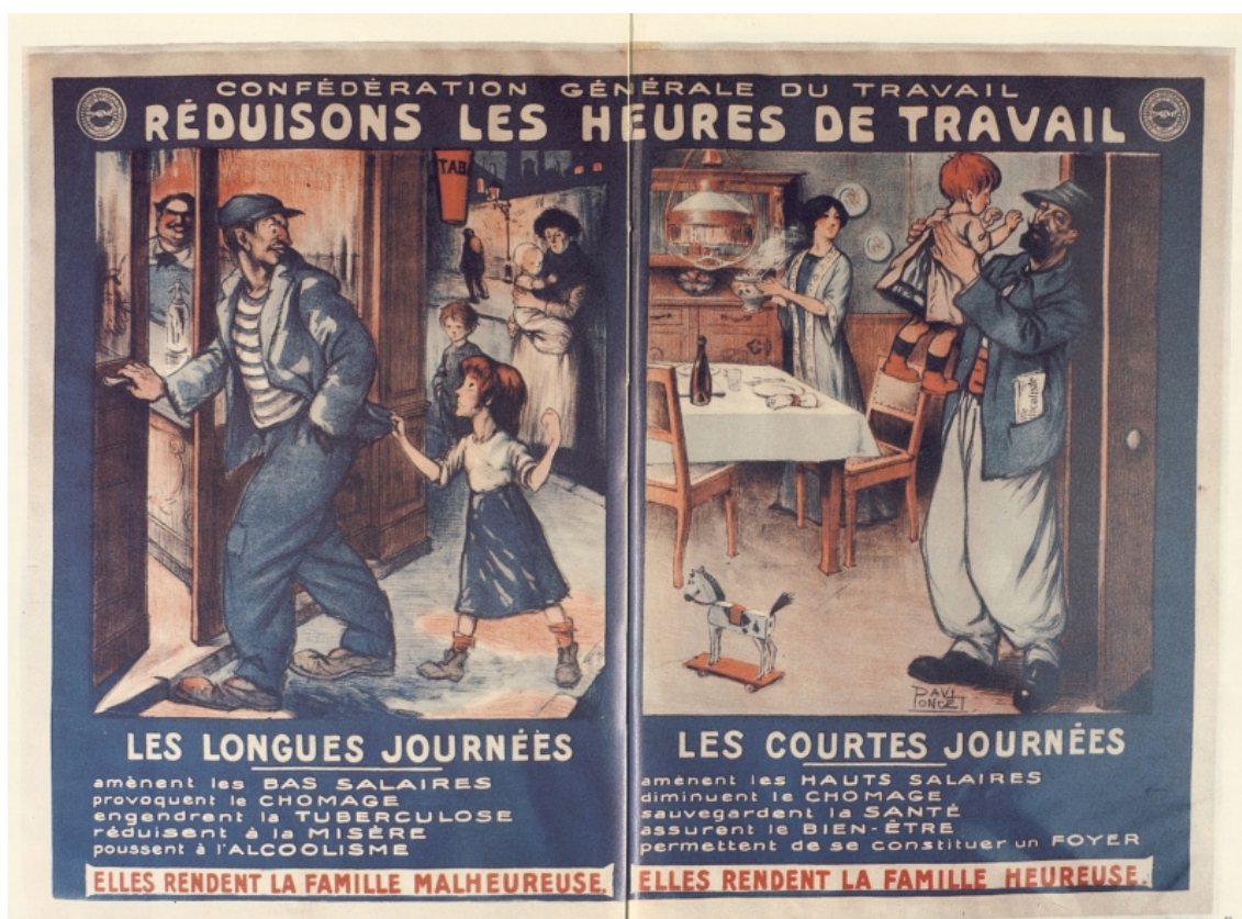
Affiche de la CGT, 1912.