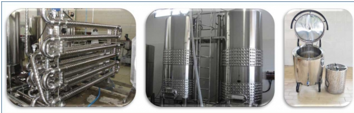
Figura 4. Equipamentos usados para elaboração de sucos de uva, por meio de aquecimento.

Foto 1 - Tubulação de extração e elaboração de sucos, com uvas circulando na tubulação e posterior separação por esgotadores; Foto 2 - Cuba vertical de extração e elaboração de sucos, com uvas estáticas e bombeamento externo do suco durante a extração; e, Foto 3 - Suquificador, novo equipamento para elaboração de suco de uva integral em pequenos volumes.