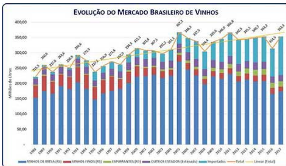
Figura 1. Destino das uvas americanas e híbridas processadas no Rio Grande do Sul, em porcentagem.

8 Por tratar-se de um registro que assume um papel referencial desta análise destacamos a estabilidade, com tendência de crescimento, da produção das variedades de uvas americanas e híbridas no Rio Grande do Sul, mesmo considerando eventuais oscilações normais de cada safra e a frustração ocorrida na safra 2016, em função das condições climáticas desfavoráveis (Tabela 1). Verifica-se, no período 2004/2017, um crescimento de 32%. Este número é ratificado pelo crescimento do volume médio do período, que foi de 8%, mesmo incluindo os valores atípicos de 2016. Relativamente ao destino das uvas produzidas, observa-se que, tanto em termos absolutos (Tabela 1), quanto relativos (Figura 1), um crescimento expressivo da demanda pela matéria-prima (uva) para ser processada na forma de suco. Tomando como referência apenas os anos dos extremos do período de análise, verificamos que esta demanda cresceu de 122,8 mil toneladas, 24,3% da produção, em 2004, para 354,7 mil toneladas, 53,1%, em 2017. O crescimento do volume da uva destinada à produção de suco entre 2004 e 2017 é de 189,0%. Em relação ao volume médio registrado no período, de 237,1 mil toneladas, este crescimento foi de 93%.