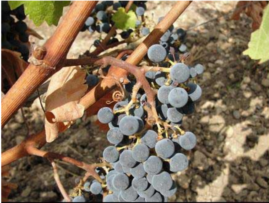
Figura 5. Cachos de Cabernet Sauvignon (esquerda) em vinhedo de clima temperado com lignificação do engaço; e Syrah (direita), próximo da colheita, em vinhedo cultivado em região de clima tropical semiárido, em Lagoa Grande (PE, Brasil), com engaço não lignificado.