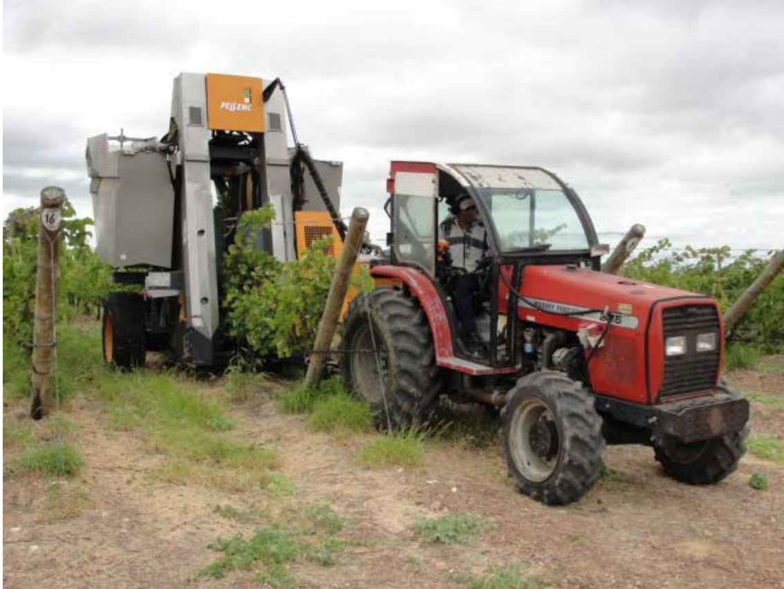
Figura 4. Colheita mecânica de uva Chenin Blanc em empresa vinícola localizada no município de Casa Nova – BA.