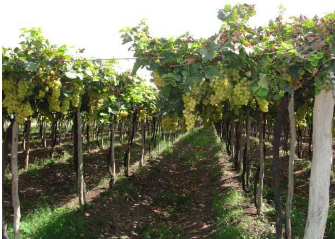
Figura 1. Cultivar Moscato Itália conduzida em pérgola, em empresa vinícola localizada no município de Casa Nova – BA.