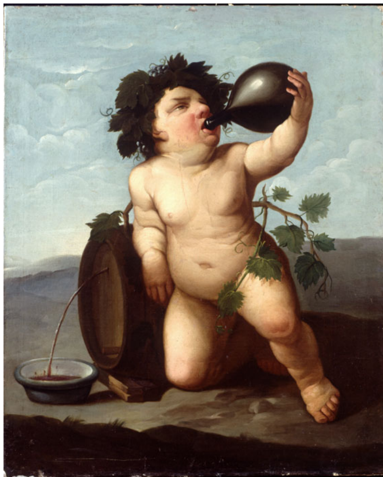
Tableau représentant Bacchus enfant (XVIII e siècle). Musée de la Culture du Vin Dinastía Vivanco (Briones, La Rioja).