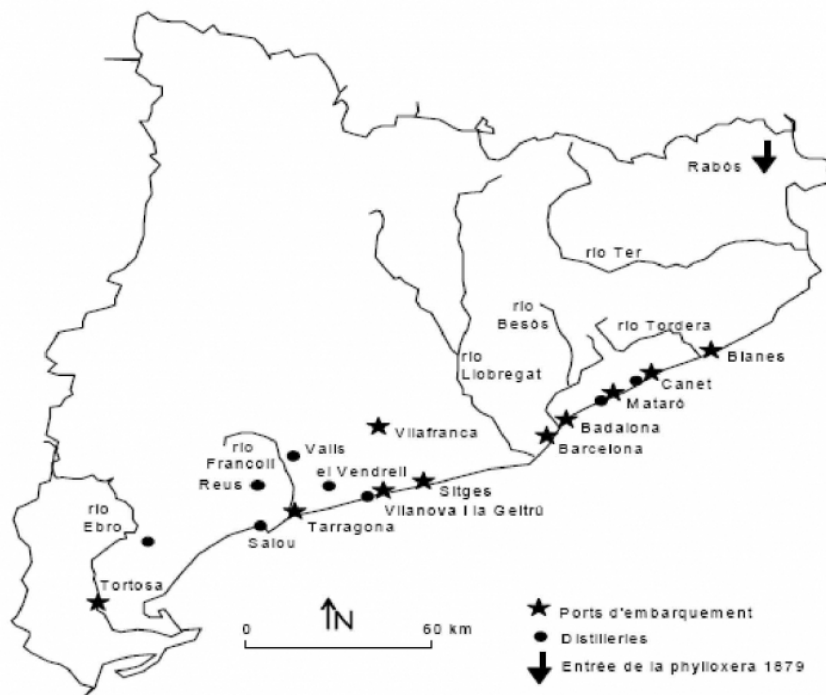
Carte de la localisation des ports et des distilleries.