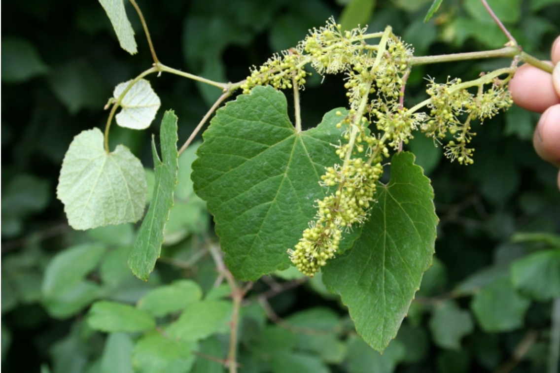
Racimo femenino tras la fecundación cruzada.