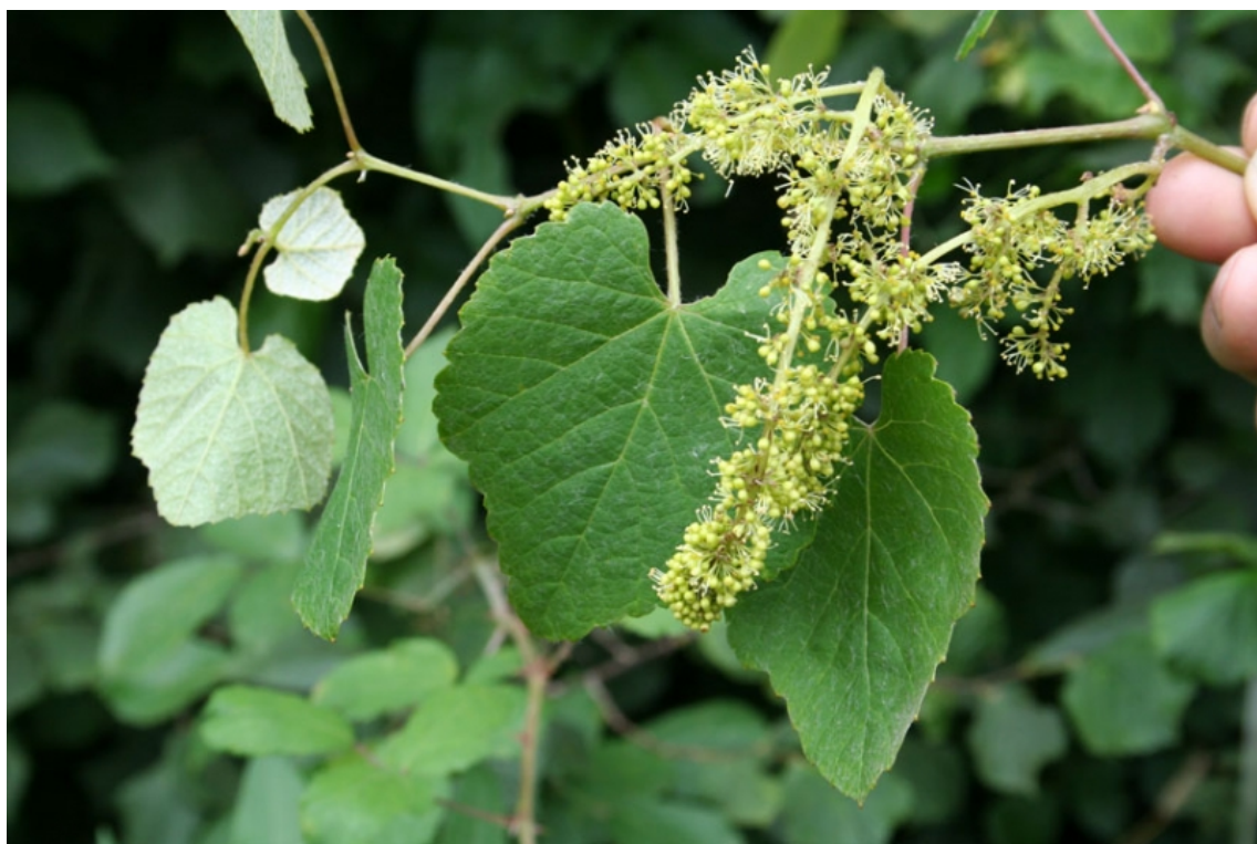
Racimo femenino tras la fecundación cruzada.