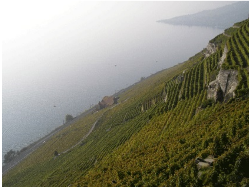
Photo de l'auteur, Lavaux et lac Léman (Suisse), 10.10.2008.