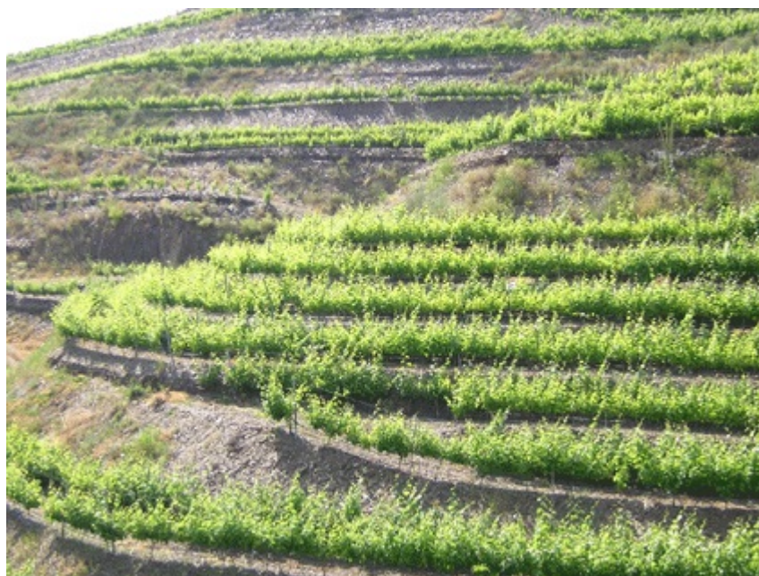
Priorat, 11.6.2004.