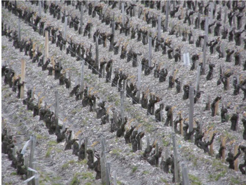
Images 1 et 2. Vignobles du Château Pichon Longueville Comtesse de Lalande, dans la région vitivinicole de Bordeaux (France).