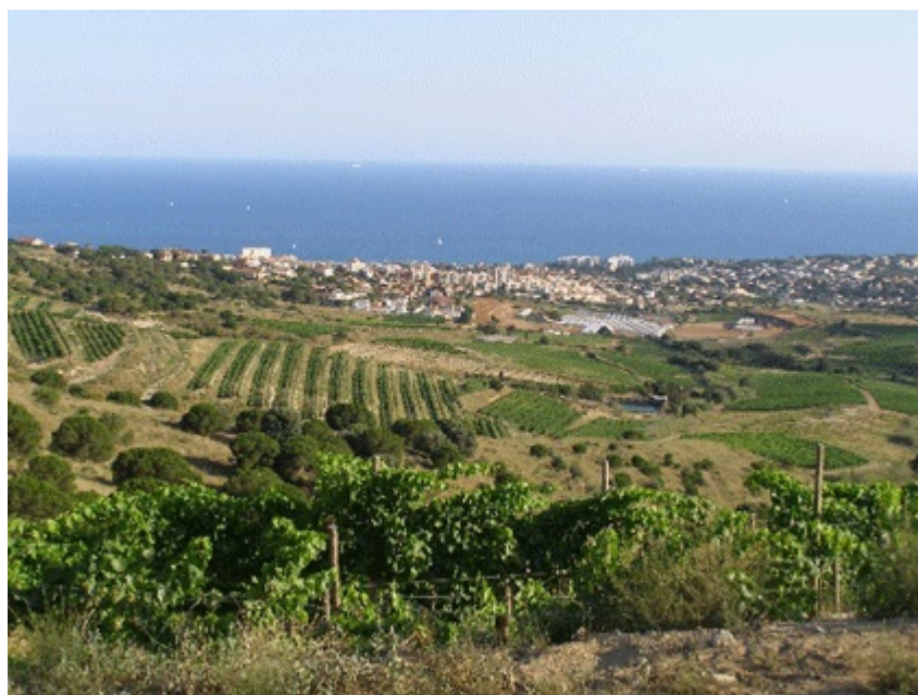
Vall de Rials dans la commune d'Alella, 7.7.2008.