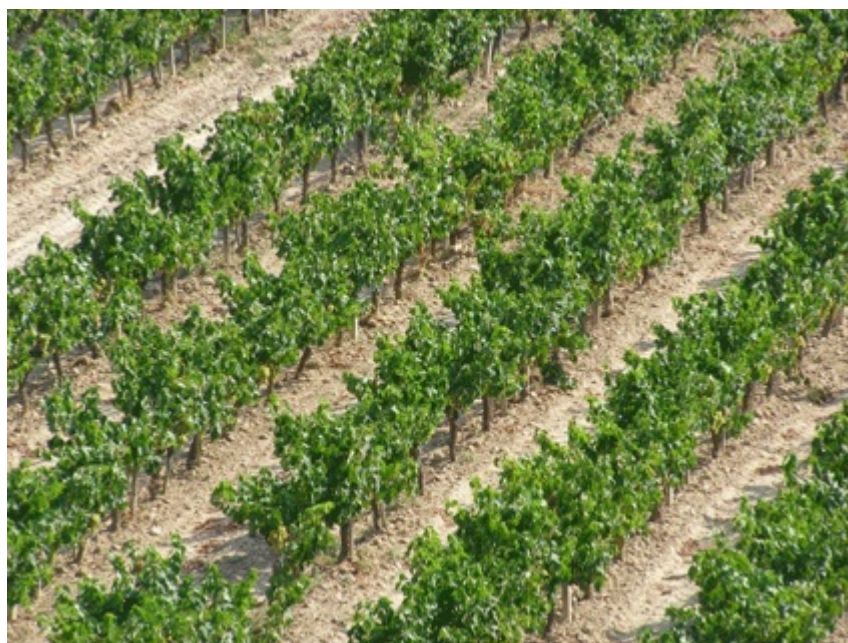
Photo de l'auteur, Sant Sadurní d'Anoia, 11.8.2006.