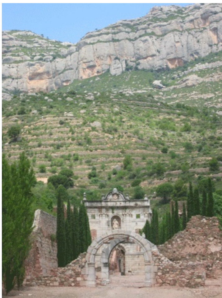
monastère de Scala Dei (Priorat, Espagne), 11.6.2004.