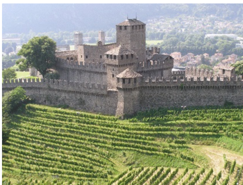
Bellinzona (Suisse), 18.6.2009.