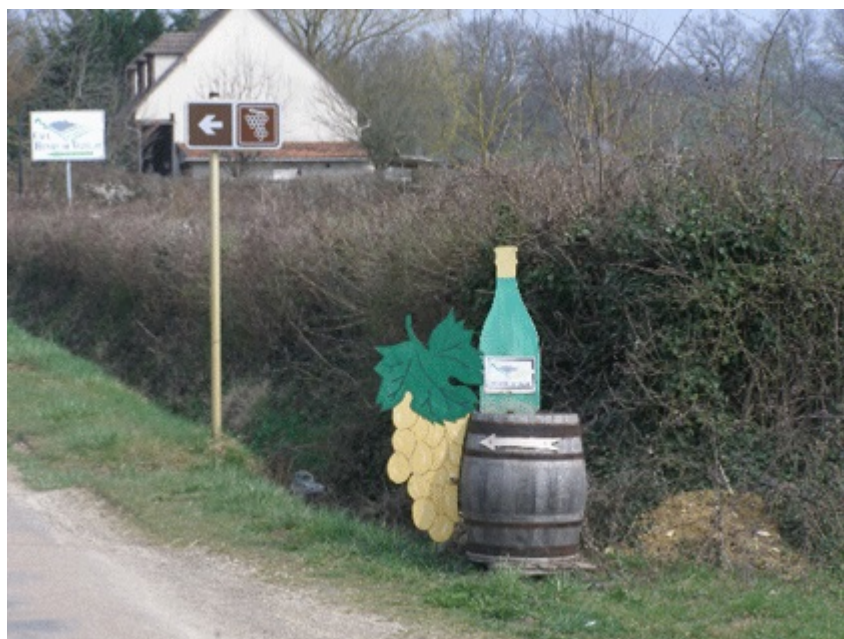
cave coopérative Henry de Vézelay (Bourgogne, France), 3.4.2009.