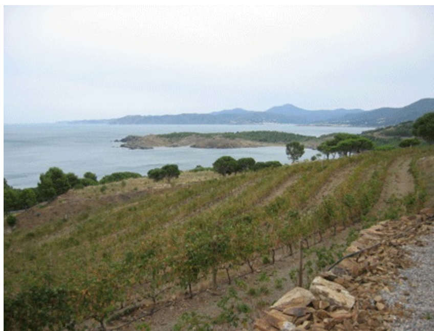
Photo de l'auteur, Castell de Peralada, vignes du Garbet, 5.11.2004.