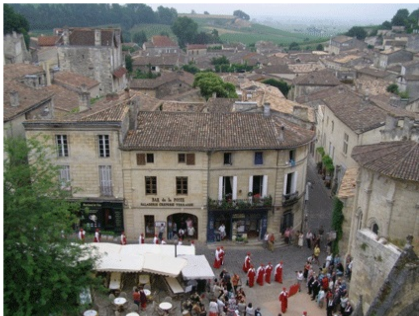
Photo de l'auteur, Saint-Émilion (France), 18.6.2006.