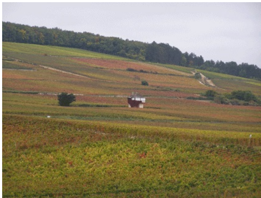
Photo de l'auteur, vignes à la commune de Beaune (France), 6.10.2008.