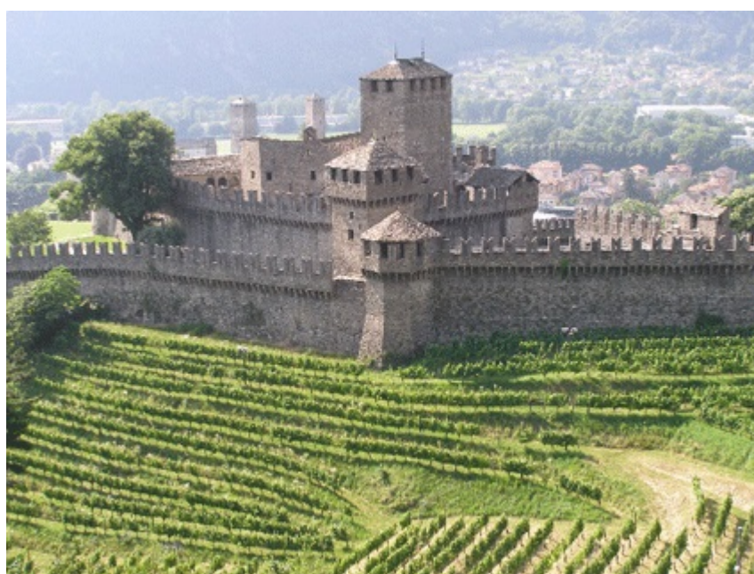
Bellinzona (Suisse), 18.6.2009.