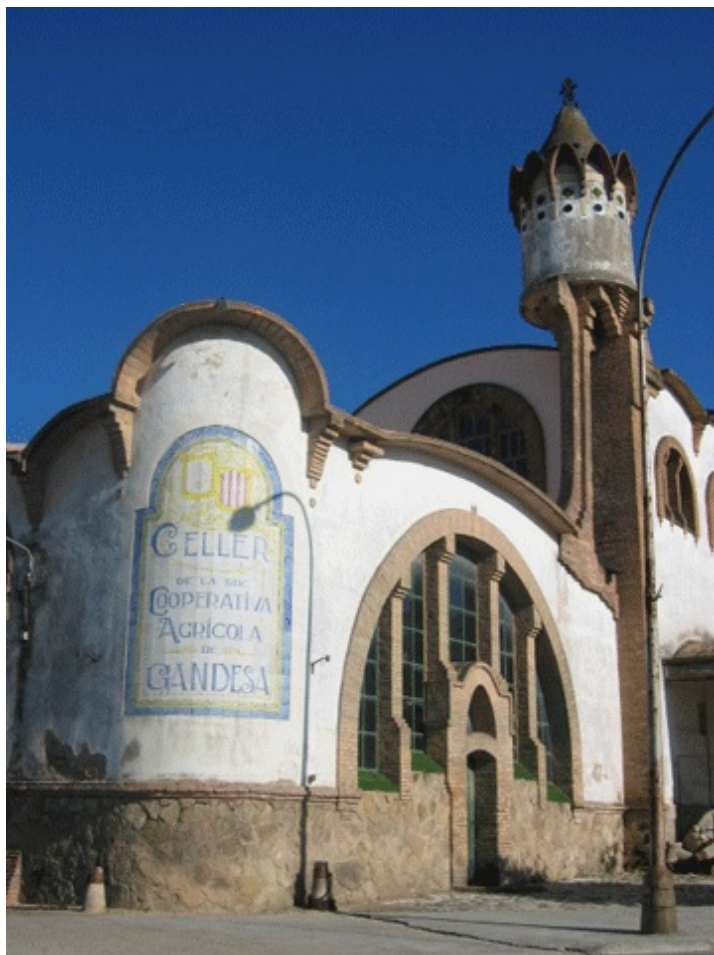
entrepôts de la comarque Terra Alta (Catalogne, Espagne), 8.7.2004.

Images 15 et 16. Entrepôts de coopératives et du mouvement moderniste à Pinnell de Brai et à Gandesa (Espagne).