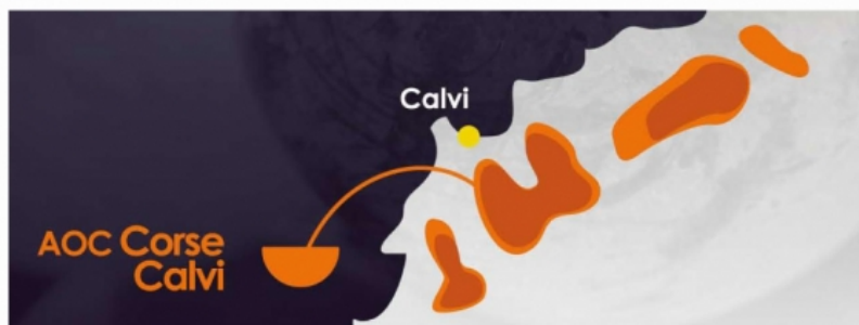
Figure 2 : l'AOC Corse Calvi ( www.vinsdecorse.com )