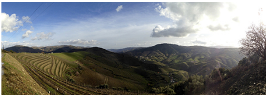
Cliché de Philippe Baumert, février 2014