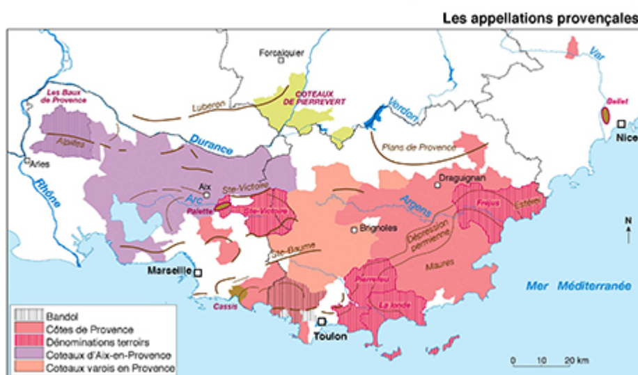
Carte 1 : Les appellations viticoles provençales.

4 Dans ce cadre contraint, l'enjeu pour la viticulture est bien de trouver de nouvelles sources de valeur ajoutée avec :