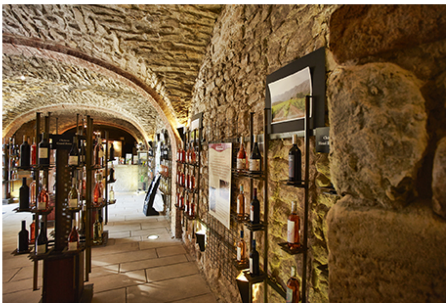
(Photo 1 : La vinothèque des Côtes de Provence - Sainte-Victoire à Trets (13) ; photo 2 : La collection variétale des Coteaux varois en Provence, abbaye de la Celle (83) ; photo 3 : Le pavillon de musique de Frank O. Gehry (vue extérieure) du vignoble Château La Coste, au Puy-Sainte-Réparate (13), Coteaux d'Aix-en-Provence (2008). Sources : photo 1 : Association des vignerons de la Sainte-Victoire ; photo 2 : Syndicat des Coteaux varois en Provence ; photo 3 : Copyright :Gehry Partners et Château La Coste 2016. Photographe Andrew Pattman -Photos.