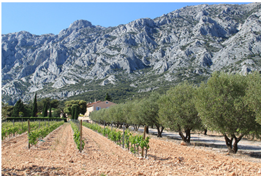
(Photo 1 : le vignoble des Côtes de Provence à Gassin (83) et le golfe de Saint-Tropez (Cliché, Ph. Moustier) ; photo 2 : le vignoble de Bandol et le village perché du Castellet (83) (Cliché Cl. Arnaud) ; photo 3 : le Vignoble des Côtes de Provence - Sainte-Victoire, au pied de la montagne chère à Paul Cézanne, à Puyloubier (13) (Cliché, Ph. Moustier) ; photo 4 : le vignoble de Cassis (13) sous le cap Canaille, au fond le massif des calanques. (Cliché, F. Moustier).