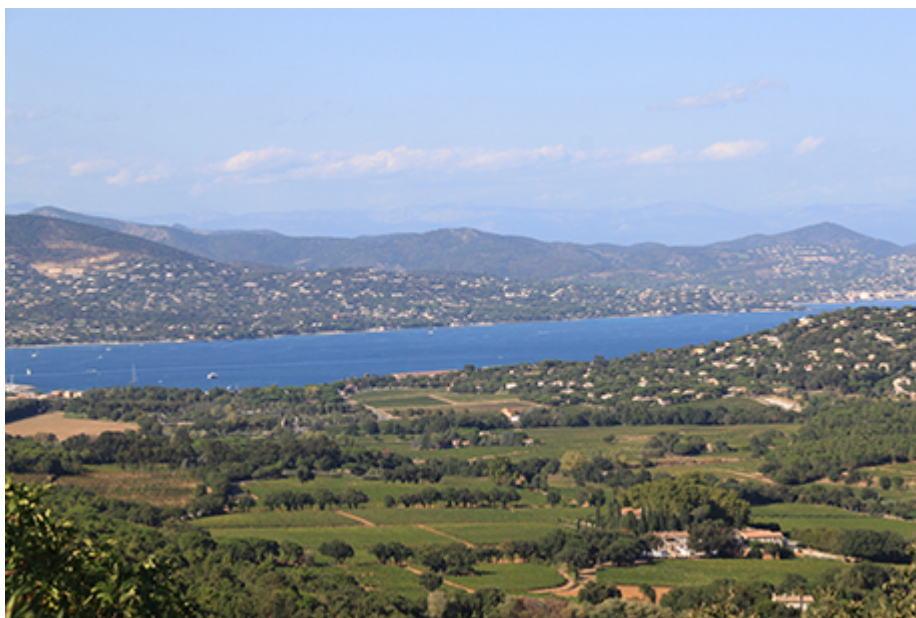
(Photo 1 : le vignoble des Côtes de Provence à Gassin (83) et le golfe de Saint-Tropez (Cliché, Ph. Moustier) ; photo 2 : le vignoble de Bandol et le village perché du Castellet (83) (Cliché Cl. Arnaud) ; photo 3 : le Vignoble des Côtes de Provence - Sainte-Victoire, au pied de la montagne chère à Paul Cézanne, à Puyloubier (13) (Cliché, Ph. Moustier) ; photo 4 : le vignoble de Cassis (13) sous le cap Canaille, au fond le massif des calanques. (Cliché, F. Moustier).