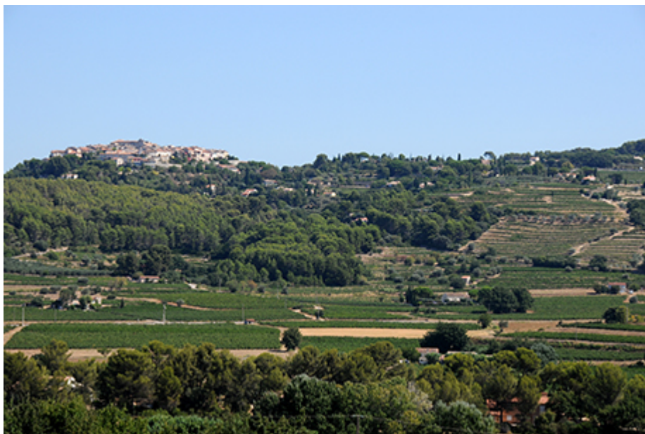
(Photo 1 : le vignoble des Côtes de Provence à Gassin (83) et le golfe de Saint-Tropez (Cliché, Ph. Moustier) ; photo 2 : le vignoble de Bandol et le village perché du Castellet (83) (Cliché Cl. Arnaud) ; photo 3 : le Vignoble des Côtes de Provence - Sainte-Victoire, au pied de la montagne chère à Paul Cézanne, à Puyloubier (13) (Cliché, Ph. Moustier) ; photo 4 : le vignoble de Cassis (13) sous le cap Canaille, au fond le massif des calanques. (Cliché, F. Moustier).