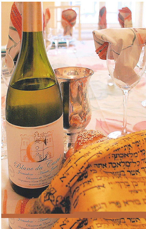
Table familiale du Kiddoush

caves continuent à produire ces vins de Kiddoush n'ayant alors pour cibles que ces seuls consommateurs pratiquants.