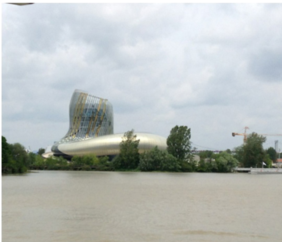
Illustration 5 : Cité du vin, nouvel emblème de l'œnotourisme mondialisé