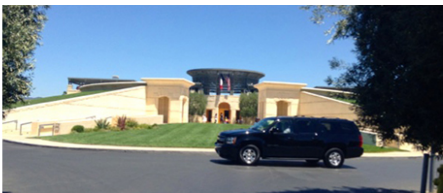
Illustration 4 : Opus One, un emblème architectural de la Napa Valley

Monde, en Argentine (clos de los Siete), mais aussi dans la Rioja, en Toscane ou à Saint-Emilion, (Illu.4). Le chai se fond désormais dans son terroir, s'enterre sous les vignes, mais préserve en son sommet une salle, une terrasse panoramique pour déguster avec vue imprenable sur le vignoble!