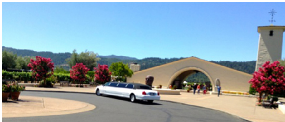
Illustration 3 : La Robert Mondavi Winery

tecte Cliff May. Le nouvel édifice s'inscrit dans l'histoire des origines de la viticulture californienne. Il s'inspire du modèle des missions espagnoles catholiques du XVIIIème siècle, pour rappeler le rôle des moines franciscains qui introduisirent la vigne à partir des années 1770, pour disposer de vin de messe, (Illu.3).