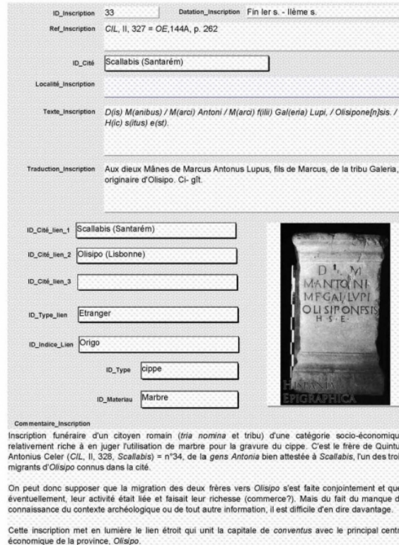
Fig. 5 : Exemple d'une fiche de la base de données épigraphiques