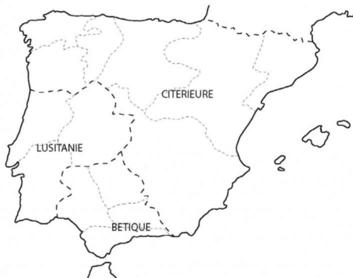
Fig. 1 : La péninsule Ibérique à l'époque impériale