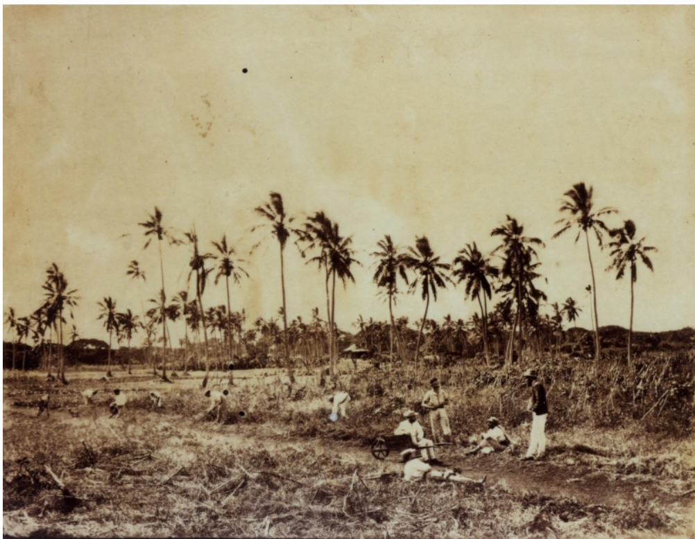
ANC collection Serge Kakou reproductions de clichés anciens, 148 Fi 36 - 82 Allan Hughan. « Concessions de déportés à l'île des Pins, 1876. »