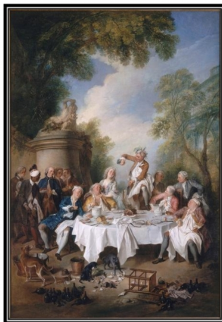
1 Lancret Nicolas, Déjeuner au jambon , 1735, huile sur toile, 188 x 123 cm, Chantilly, Musée Condé.