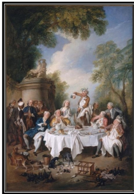
1 Lancret Nicolas, Déjeuner au jambon , 1735, huile sur toile, 188 x 123 cm, Chantilly, Musée Condé.