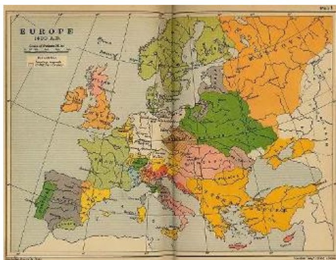
Cuadro 1.- Europa y el Reino de Hungría en 1490