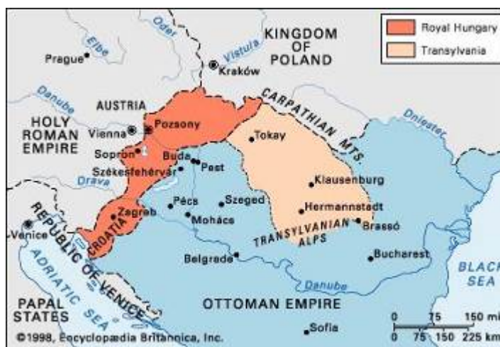
Cuadro 2.- Hungría dividida en tres partes