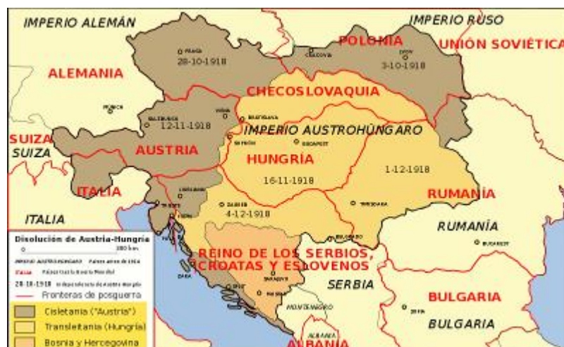
Cuadro 6.- Disolución del Imperio Austro-Húngaro tras la I GM.