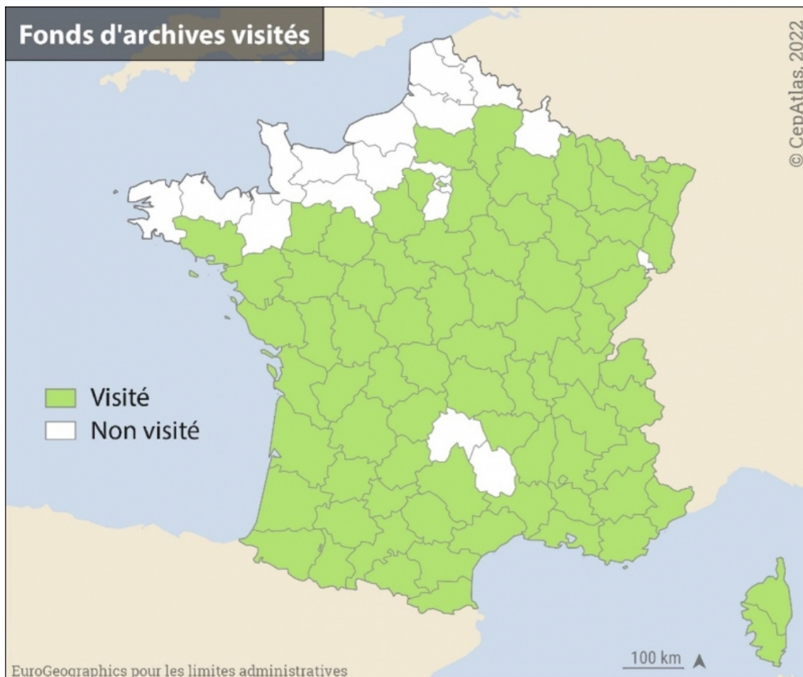
Figure 1 : Dépôts d'Archives Départementales visités dans le cadre du programme CepAtlas.

Les déplacements ont eu lieu en 2020-2021, fortement perturbés par les restrictions sanitaires. La carte utilise les départements actuels mais l'ensemble des dépôts d'archives des départements d'Ile-de-France ont été visités (Paris, Seine-et-Marne et Yvelines), tout comme les archives qui correspondent à l'actuel Territoire de Belfort (qui faisait partie du Haut-Rhin au début du XIX e siècle). Seuls les dépôts d'Archives Départementales des Ardennes, de l'Eure et de la Lozère n'ont pu être visités car les conditions de déplacement et/ou d'accès aux salles de lecture étaient trop restreintes et que les inventaires (ainsi que des échanges avec les archivistes) indiquaient qu'aucun document n'avait été conservé.