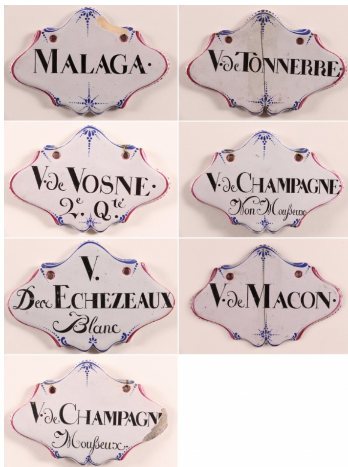
Figure 1. 7 grandes plaques en faïence de réverbère, L. 15 cm, Aprey, c. 1765-1770, musée de Langres

N° d'inventaire : 943-2-143 ; 943-2-141 ; 943-2-49-81 ; 943-2-50 ; 943-2-18 ; 943-2-49 ; 943-2-140.