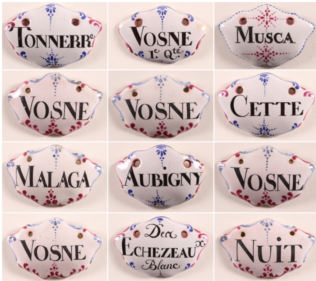
Figure 2. 12 petites plaques en faïence de réverbère, L. 6,5 cm, Aprey, c. 1765-1770, musée de Langres

N° d'inventaire : 943-2-311 ; 943-2-54 ; 943-2-55 ; 943-2-56 ; 943-2-57 ; 943-2-59 ; 943-2-60 ; 943-2-61 ; 943-2-62 ; 943-2-80 ; 943-2-82 ; 943-2-83.